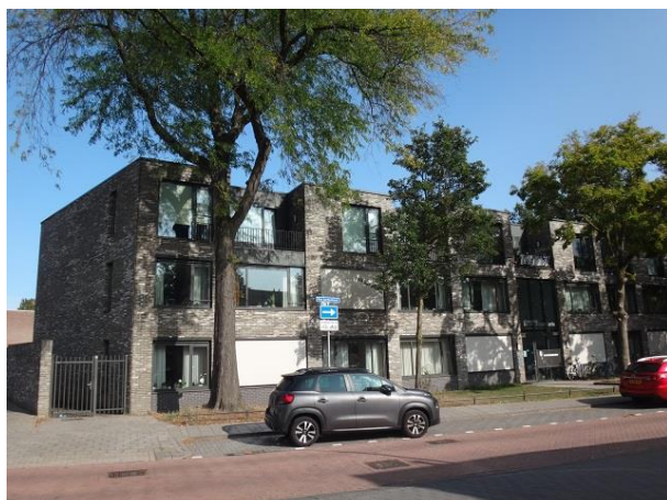
Don Sartostr 66-Vogelenzang 7

Bij nr. 45 maakt de gevel een sprong voorwaarts.