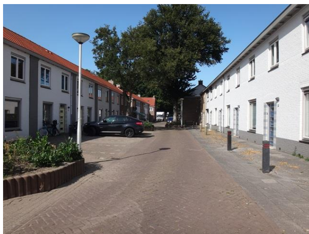
Dr P v Hoekstr 18-8

Voordat we rechtsaf gaan kijken we even verder naar de gevels van nr. 7 tm 12 die dezelfde zijn als 4, 5 en 6. Ook hier vallen de klossen onder de goten op.