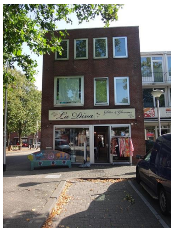
P vd Elsenplein 65

De woningen hebben hier betegelde voortuintjes met hekwerk. We lopen terug, de Baarshof weer uit en dan rechtsaf, via de Visserijstraat naar, de eerste straat rechts, de Forelstraat, waar we op nr. 22 tm 6 de negen woningen zien die horen bij het bouwplan voor 29 woningen, in 1959 gebouwd door Publieke Werken en Arch. bur. Jos. Donders waarvan we net aan het Visserijplein de andere twintig woningen zagen. Dezelfde onduidelijke gevels.