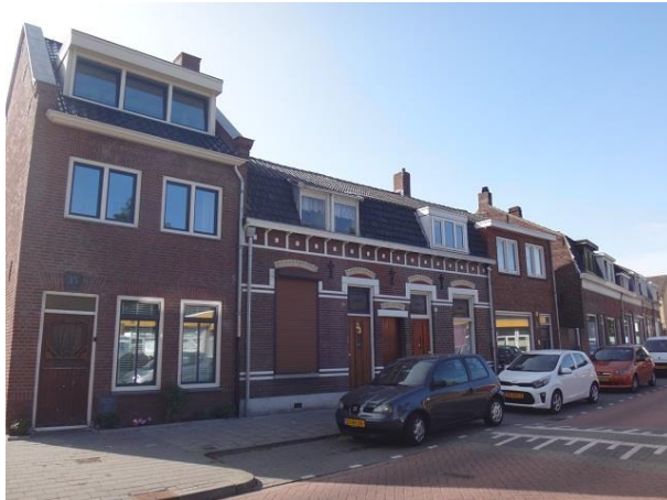
Don Sartostr 35-29

Nr. 21 tm 27 zijn vier woningen die in 1910 gebouwd zijn door de 'kinderen Jac. van Haaren'. Ook hier hadden alle vier de woningen een smal en hoog zesruits venster. Het raam van nr. 21 werd in 1968 vergroot, bij nr. 23 gebeurde dat in 1965, bij nr. 25 in 1959 en 27 in 1962. Van de dakkapellen verstrekt het bouwarchief deze keer geen bouwjaar.