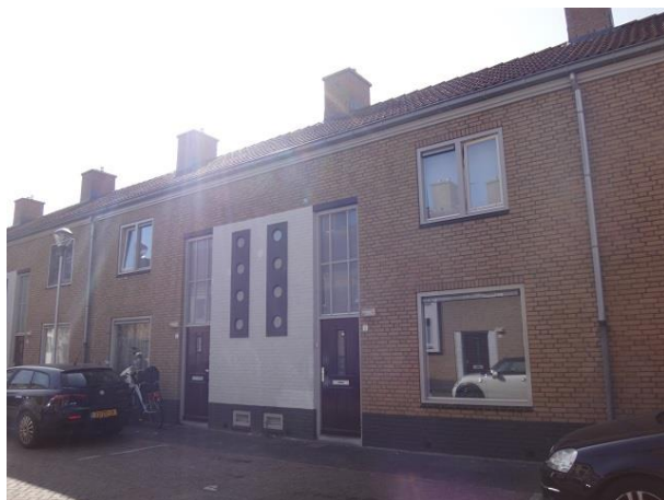
P v Haarenstr 5-7

We zien hier aan de linkerzijde het type met de vier ramen tussen twee voordeuren eerst met kleine ramen waarbij het witte vlak al ophoudt halverwege de deurhoogte en dan na de verbreding van de straat de variant waarbij het witte vlak tot beneden doorloopt en het vlak een bakstenen ondergrond heeft.