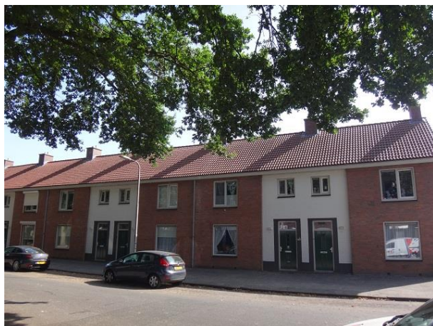
V vd Heuvelstr 48-40

die met landbouw te maken hadden. Namen die verder niet interessant genoeg zijn om hier verder toegelicht te worden.