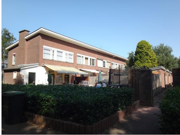
Warmoesstr 20 muur

In de rij 'terug'woningen zien we dat ongeschilderde risaliserende kolommen hier de huizen hun eigen gezicht geven in tegenstelling met de huizen aan de 'heen'kant die vooral door de doorlopende raamstrook op de verdieping meer gemeenschappelijkheid uitstralen.