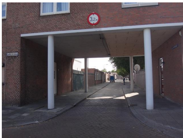
J Truyenlaan 6

Het plan begint op nr.4. Twee ramen rechts in de gevel hebben in 1991 een andere indeling gekregen. De oorspronkelijke indeling zien we rechts bij de twee ramen boven de onderdoorgang.