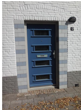
Dr P v Hoekstr 12

De linkerwoningen hebben een verticaal risaliserende strook die oorspronkelijk ongeschilderd zal zijn geweest en nu grijs is geverfd. De ramen zijn hier kaal gemaakt. Oorspronkelijk zullen ze vierruits geweest zijn.