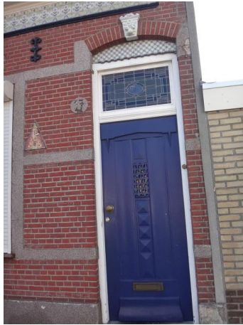
Don Sartostr 27 D

Nr. 21 tm 27 zijn vier woningen die in 1910 gebouwd zijn door de 'kinderen Jac. van Haaren'. Ook hier hadden alle vier de woningen een smal en hoog zesruits venster. Het raam van nr. 21 werd in 1968 vergroot, bij nr. 23 gebeurde dat in 1965, bij nr. 25 in 1959 en 27 in 1962. Van de dakkapellen verstrekt het bouwarchief deze keer geen bouwjaar.