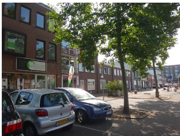
P vd Elsenplein 59-49

We lopen weer terug naar de Visserijstraat en gaan daar rechtsaf naar het Pater van den Elsenplein waar we meteen links af gaan voor de nummers 65 tm 60. Deze panden, 2 winkelhuizen en vier woningen zijn in 1958 gebouwd door aannemer H. Cools naar een ontwerp van Ouborg en van der Wegen. Twee winkelhuizen van drie lagen hoog en vier woningen van twee lagen.