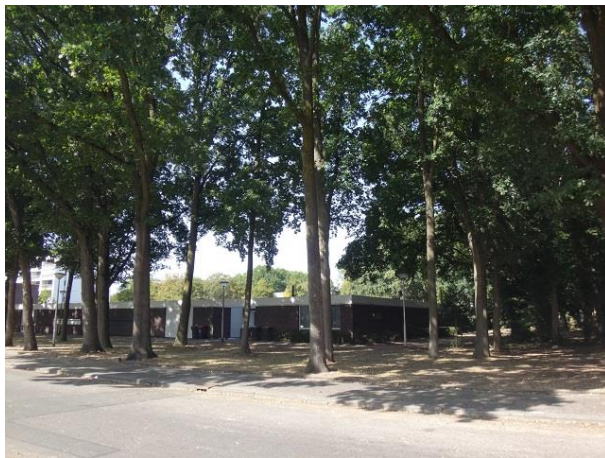
Ezelse Akkers 26-33

In de Jan Truijelaan lopen we nog even naar links om daar nog wat 'vergeten goed' op te zoeken. Het gaat om de panden 9 en 11. Nr. 9 is een in 1989 door Publieke Werken gebouwd 'Noodgebouw Buurthuis Bloemisterijstraat'. De tekening is van Architectenburo Storimans. Twee lokaaltjes, een zaaltje, een bar en een keukentje, dat is de hele inhoud. Nr. 11 is een trafostation. In het archief treffen we geen verdere gegevens aan.