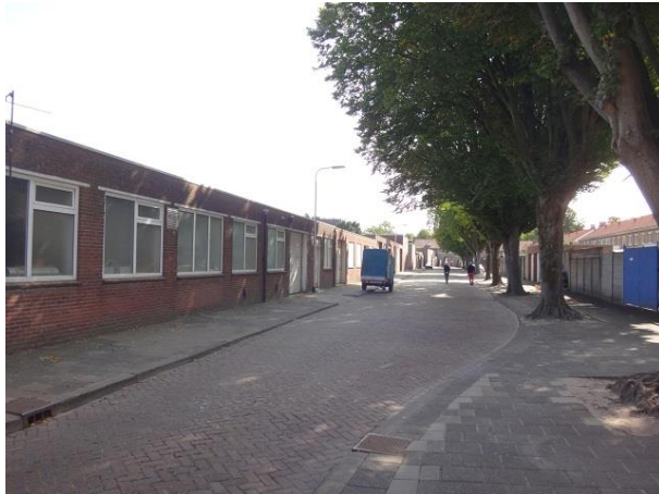
Ds Kopstr 4-38

We gaan onder de opgetilde woningen door en komen in de Dominee Kopstraat. In de onderdoorgang zien we de voordeuren van nr. 1 en 2. Maar de straat valt tegen. Hier staan alleen garages, bergingen schuttingen en tuinmuren van de huizen aan de Broekhovense weg (links) en de Dr. P. van Hoekstraat (rechts). Bomen verzachten gelukkig de omstandigheden.