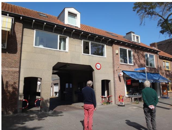
Ds Kopstr 3A

Aan het eind van de straat zien we weer een onderdoorgang maar met een onverwachte vormgeving. Met afgeschuinde hoeken en links en rechts aparte voetgangersonderdoorgangen die aan de bovenkant enigszins getoogd zijn. Tegen de gevel zijn grijze platen aangebracht. Het dak heeft een ruime overstek gekregen en onder de goot zien we nog 'ouderwetse' klossen.