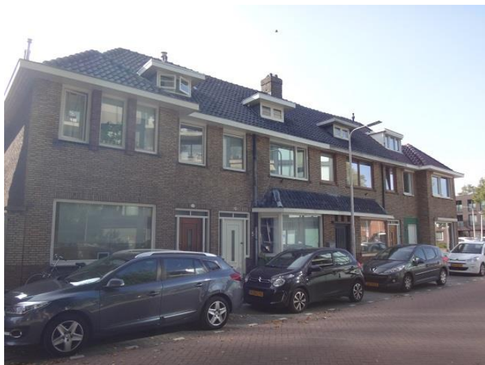
Don Sartostr 7-1

Via het parkeerterrein lopen we zuidwaarts en dan voor de blinde zijgevel van een woonhuis links- en dan meteen weer rechtsaf de Don Sartostraat in.