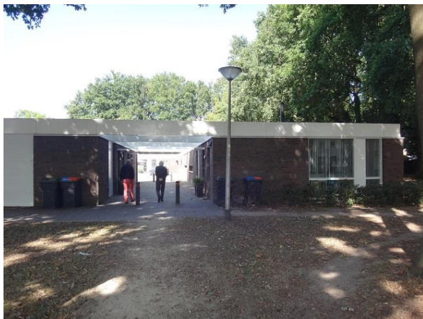
Ezelse Akkers 30-33