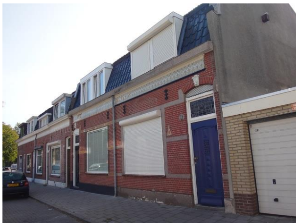
Don Sartostr 17-27

De plataan hier aan deze kant van het gebouw heeft een belangrijke rol in het ontwerpproces gespeeld. Het grijs/zwarte gebouw heeft drie en, waar het de het Pater van den Elsenplein benadert, vier lagen en herbergt 51 appartementen, een wijkcentrum, een dagkapel, een bibliotheek, een dagkapel en een parkeergarage. Het toen nog jonge architectenbureau JMW heeft het gebouw ontworpen onder het ervaren toezien oog van Luijten Smeulders.