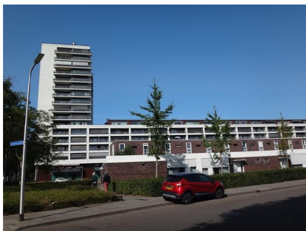
R Zuid 38-346 A

Na nr. 60 draaien we ons om. Daar zien we een rij vrij nieuwe lage patiowoningen met daarachter een hoog woongebouw. Het betreft hier het woninbouwplan Leijendael dat hier op het terrein van voormalige glazen LTS van architect Jos. Schijvens in 2003 gebouwd is. In totaal gaat het om 189 woningen en 7 kantoren. Het ontwerp is van de Architecten Werkgroep. We gaan het zien en beginnen daarvoor op nr. 21. Eerst een rij van twaalf patiobungalows onderbroken door een smal zijstraatje, de nrs. Jan Truijelaan 21 tm 41 en, op de hoek, Ezelse Akkers nr.1. De nrs. 35 en 37 hebben van de architecten een voortuintje gekregen.