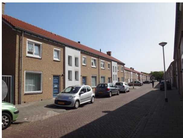
Dr Lovinkstr 2-8

Ook de volgende zes woningen, nrs. 26 tm 36, die helemaal identiek zijn, bekijken we van hier uit. Het zijn alle woningen van het 176-woningenplan. Dan gaan we tussen de nrs. 24 en 26 weer links af de Dr. Lovinkstraat in. Het eerste dat opvalt is dat er slechts één boom in de straat staat.