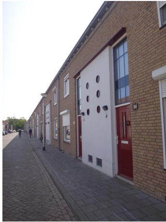
Dr Lovinkstr 11-27

Aan de rechterkant zien we andere gevels. Hier is het vlak tussen twee voordeuren en de hoge ramen er boven gestuukt. De zes 'kijkgaten' die vroeger in de baksteen waren opgenomen krijgen door het omgevende witte stuukwerk een extra accent. Ook hier zijn de ramen qua indeling weinig afwijkend van de oorspronkelijke uitvoering. Alle woningen zijn gebouwd in het kader van het 188-woningenplan van PW en Ir. G. Beekers en F. van Meerendonk. De woningen hebben hier hun schoorstenen behouden. Het betreft de volgende adressen: links nrs. 2 tm 44, 22 woningen, en rechts nrs. 1 tm 47, 24 woningen.