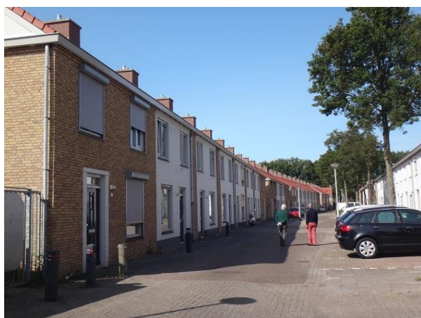
V vd Heuvelstr 47-1

Het eerste wat ons opvalt als we de straat binnen komen is de royale aanwezigheid van bomen. En ook hier bij alle huizen schoorstenen. Links zijn deze zwart geschilderd en voorzien van een afdekplaat.