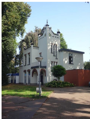
Berglandweg 32 B

mansardekap met rond de voordeur de woning en links, waar we drie identieke ramen zien, de stal.