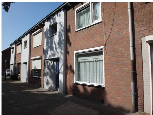
P vd Elsenplein 4-6

We gaan er onderdoor en zien aan het Pater van den Elsenplein terug kijkend dezelfde gevel, aan beide zijden geflankeerd door de gevels van winkelhuizen. Rechts Pater van den Elsenplein 1 en 2 en links 3, 4, 5 en 6.