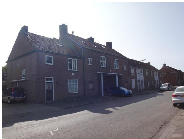
J Truyenlaan 4-12