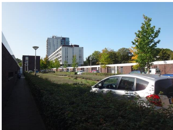
Ezelse Akkers 38-150 binnenterrein

door SVW in 1994 gerenoveerd. Wat opvalt is dat deze rijen de schoorstenen hebben behouden.