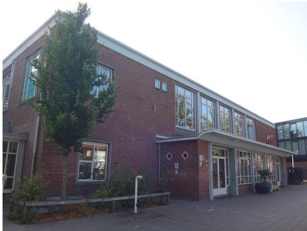
Oude Hilvarenbeekseweg 15 An

Dan staat er in de buurt van dit huis nog een vrijstaande woning. Deze heeft zijn adres aan de Oude Hilvarenbeekseweg en wel nr. 17. Het bouwjaar is 1993. Ook hierover zwijgt het bouwarchief.