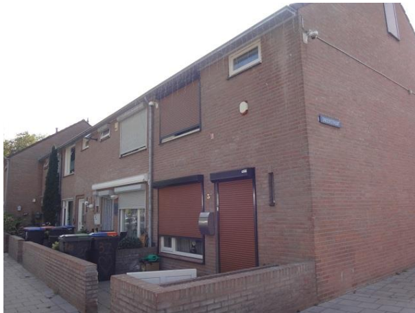
Don Sartostr 37-43

Aan de overkant zien we op nr. 60 de openbare basisschool Pantarhei. Deze school heeft meer vestigingen in Tilburg. We kwamen er eerder een tegen in de Galjoenstraat. Ook over deze school geeft het bouwarchief geen informatie. Het bouwjaar is volgens de BAGviewer 1975. Aan de buitenzijde zijn de lokalen duidelijk afleesbaar.