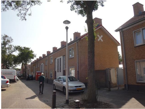
P v Haarenstr 33-51

Schoorstenen op ieder huis en op de zijgevels van huizen aan de rechterkant een merkwaardig kruis een teken dat normaal gebruikt wordt om aan te geven dat er iets mis is, maar hier niet zo bedoeld zal zijn.