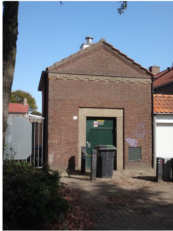
Raiffeisenstr 54 Trafo

Maar eerst vraagt nr. 54 aandacht. Deze in 1954 in opdracht van de Directeur van het Gemeentelijk Energiebedrijf gebouwde hoogspanningsruimte is ontworpen door F. van Meerendonk: hoog met een dwarskap en een timpaan. En zelfs een bakstenenschoorsteen die door een onderhoudsfanaat met witte plaatjes trespas is ingepakt. Ook de langskap boven de berging rechts van het huisje hoorde bij Van Meerendonks ontwerp. De twee kolommen die nu nog rechts in beeld zijn, waarvan één in de hoek hadden op de plaats waar we nu een witte kunststof garagedeur zien hun spiegelbeeld.