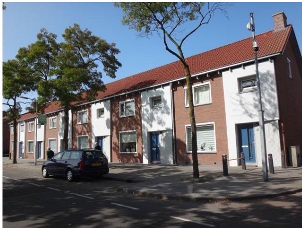
P vd Elsenplein 13-18

Aan de rechterkant zien we andere gevels. Hier is het vlak tussen twee voordeuren en de hoge ramen er boven gestuukt. De zes 'kijkgaten' die vroeger in de baksteen waren opgenomen krijgen door het omgevende witte stuukwerk een extra accent. Ook hier zijn de ramen qua indeling weinig afwijkend van de oorspronkelijke uitvoering. Alle woningen zijn gebouwd in het kader van het 188-woningenplan van PW en Ir. G. Beekers en F. van Meerendonk. De woningen hebben hier hun schoorstenen behouden. Het betreft de volgende adressen: links nrs. 2 tm 44, 22 woningen, en rechts nrs. 1 tm 47, 24 woningen.