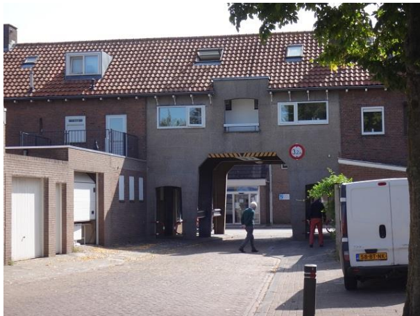
Ds Kopstr 3

We gaan onder de opgetilde woningen door en komen in de Dominee Kopstraat. In de onderdoorgang zien we de voordeuren van nr. 1 en 2. Maar de straat valt tegen. Hier staan alleen garages, bergingen schuttingen en tuinmuren van de huizen aan de Broekhovense weg (links) en de Dr. P. van Hoekstraat (rechts). Bomen verzachten gelukkig de omstandigheden.