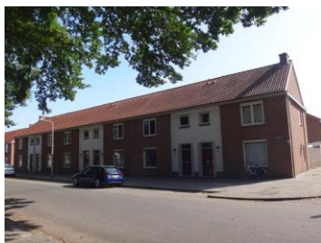
J Truyenlaan 24-14

Links 24 woningen, nrs. 47 tm 1 en rechts 48 tm 2. Op het eind van de straat wordt ze aanzienlijk smaller en krijgen de woningen andere gevels. Het travee van de gekoppelde voordeuren is hier wit geschilderd. Het andere travee risaliseert en is ongeschilderd gelaten. Ook hier waren de vensters in het ongeschilderd deel oorspronkelijk in vieren gedeeld.