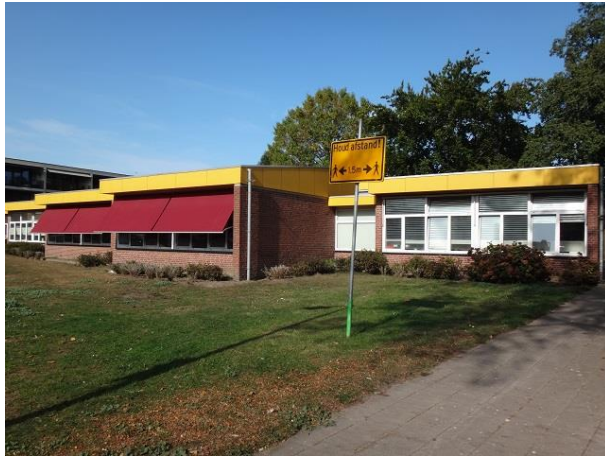
Don Sartostr 60 B

Aan de overkant zien we op nr. 60 de openbare basisschool Pantarhei. Deze school heeft meer vestigingen in Tilburg. We kwamen er eerder een tegen in de Galjoenstraat. Ook over deze school geeft het bouwarchief geen informatie. Het bouwjaar is volgens de BAGviewer 1975. Aan de buitenzijde zijn de lokalen duidelijk afleesbaar.