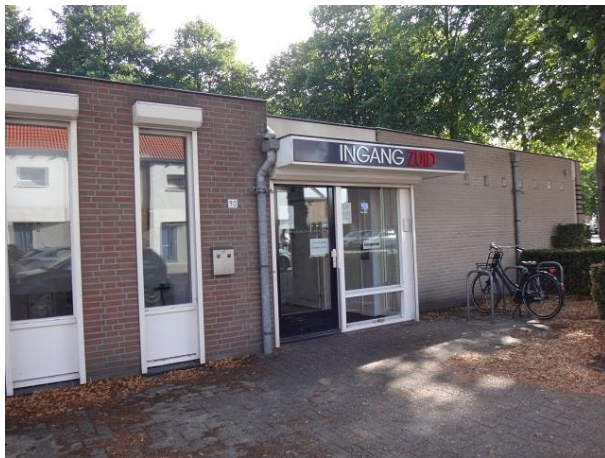
P vd Elsenplein 90 A

Eerst nr. 90 een eenlaags gebouw met plat dak en aan alle kanten gesloten rolluiken. Het bouwarchief is net zo gesloten als deze rolluiken. Het geeft enkel het bouwjaar prijs: 1988.