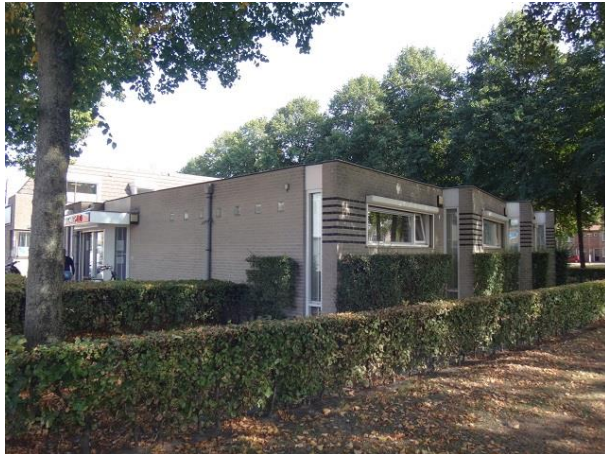
P vd Elsenplein 90 B