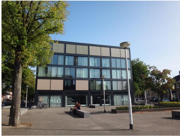
Don Sartostr 2.40-Oude Hilverweg 7

We passeren het zwarte woongebouw op nrs. 1, 3, 5 en 7 waarvan we zojuist de andere kant zagen en steken over en gaan de Broekhovenseweg in.