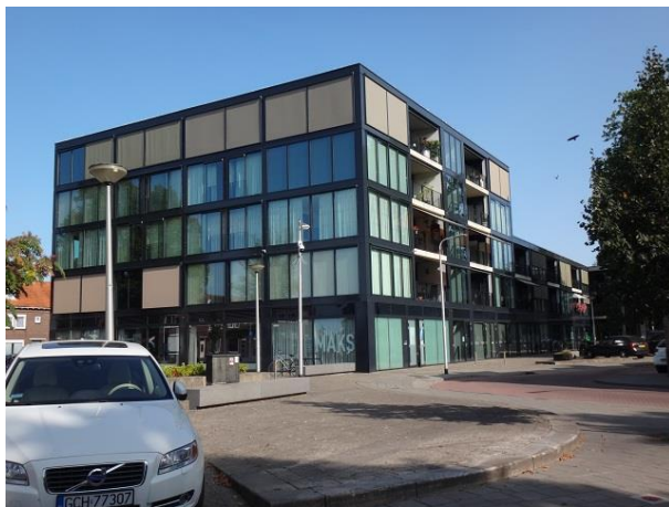
Don Sartostr 2.40-Oude Hilverweg 1 A

Dan gaan we nog even rechtsaf voor een stukje Forelstraat. Nr. 2, 2a, 2b, 4, 4a en 4b, om precies te zijn. Deze zes woningen dateren van 1977 en zijn gebouwd in opdracht van Bouwbedrijf A. van Loon en ontworpen door Bouwprojectburo Le Comte. De eerste twee woningen zijn breder dan de volgende vier. De poort tussen woning 2a en 2b is een onderdoorgang naar het achterterrein. Het balkon er boven hoort bij woning 2b. Nr. 4a heeft sinds 2010 een dakkapel.