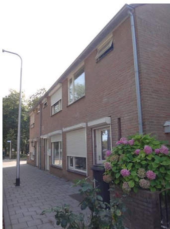
Don Sartyostr 45-49

We steken weer over. Op nr. 37 tm 49 zien we daar nog het vervolg van het bouwplan van Publieke Werken en Architectenburo Heerkens voor 17 eengezinswoningen en 32 gestapelde woningen. Deze zeven eengezinswoningen maken het plan compleet. We zagen dit type ook al aan de Baarshof en de Brasemstraat, ook gebouwd in 1983.