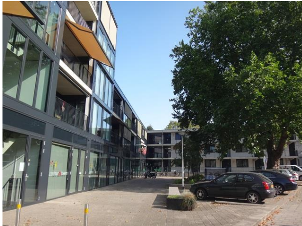
Don Sartostr 2.40-Oude Hilverweg 1 B

De plataan hier aan deze kant van het gebouw heeft een belangrijke rol in het ontwerpproces gespeeld. Het grijs/zwarte gebouw heeft drie en, waar het de het Pater van den Elsenplein benadert, vier lagen en herbergt 51 appartementen, een wijkcentrum, een dagkapel, een bibliotheek, een dagkapel en een parkeergarage. Het toen nog jonge architectenbureau JMW heeft het gebouw ontworpen onder het ervaren toezien oog van Luijten Smeulders.