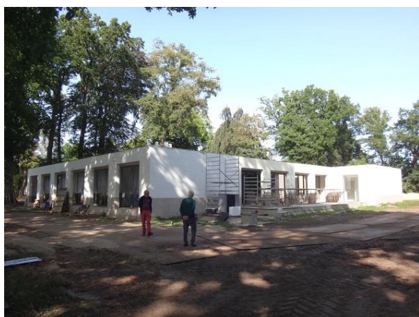
Berglandweg 32 F

De kliniek voor plastische chirurgie is intussen moeten wijken voor een kliniek voor patiënten met eetstoornissen.