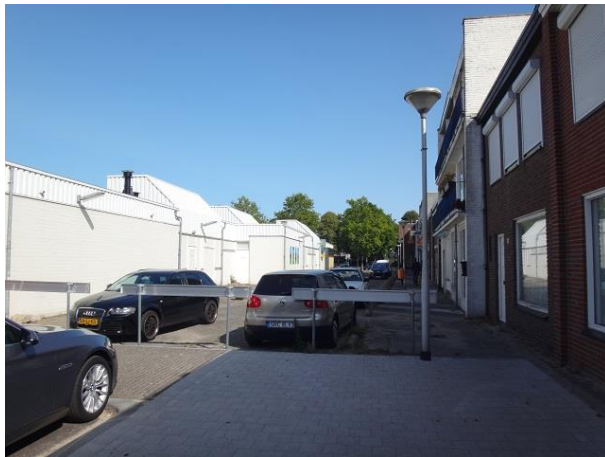
P vd Elsenplein 105 en 44-54

We kijken vervolgens naar het witte gebouw midden op het plein dat het huisnummer 105 heeft gekregen. Het staat er al sinds 1976. Niet goed te begrijpen, een gebouw dat alleen maar achterkanten lijkt te hebben maar hier wel, zo midden op het plein, van alle kanten zichtbaar is. We maken er een verbeterpunt van. Het gaat om de voormalige Jumbowinkel.