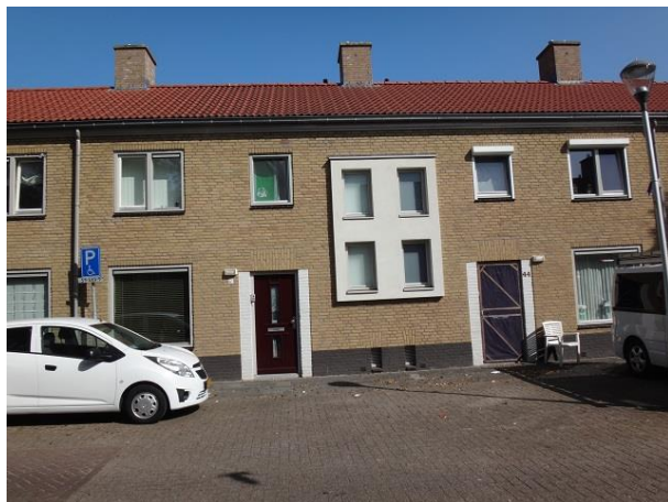
P v Haarenstr 42-44