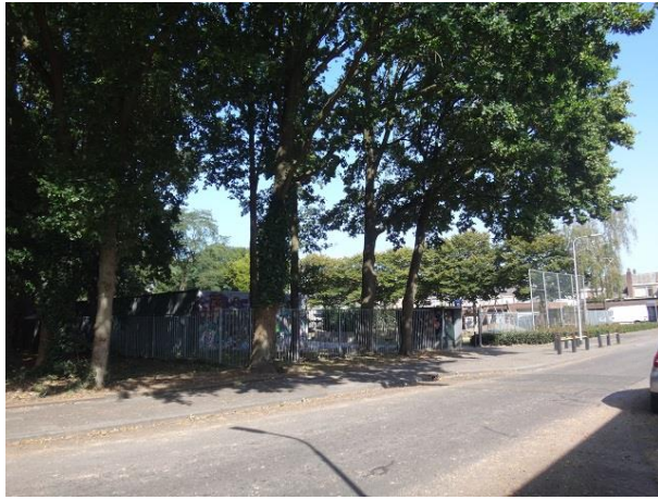
J Truijelaan 9

Op het einde van het plantsoen zie we, dwars daar op, drie woningen aan een pad dat naar de Jan Truijelaan gaat en dat wij volgen, nrs. 35, 34 en 33.