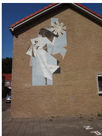
Dr Lovinkstr 8 Dk

Ook hier een straat die zich na vier huizen verbreed, na de gevel van nr. 8.