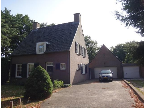
Oude Hilvarenbeekseweg 17

Dan staat er in de buurt van dit huis nog een vrijstaande woning. Deze heeft zijn adres aan de Oude Hilvarenbeekseweg en wel nr. 17. Het bouwjaar is 1993. Ook hierover zwijgt het bouwarchief.