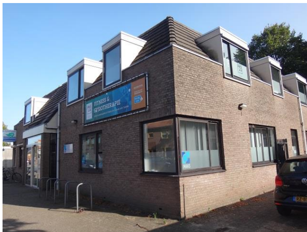
P vd Elsenplein 86-88

Eerst nr. 90 een eenlaags gebouw met plat dak en aan alle kanten gesloten rolluiken. Het bouwarchief is net zo gesloten als deze rolluiken. Het geeft enkel het bouwjaar prijs: 1988.