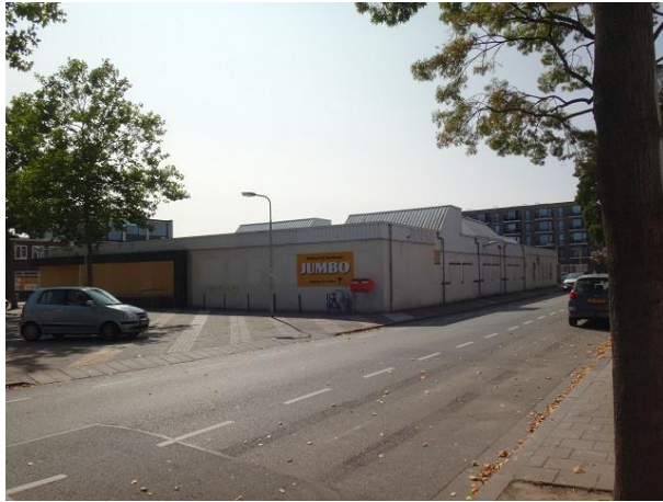
P vd Elsenplein 105 en A

zwijgt het bouwarchief nog. Er zijn 34 adressen in ondergebracht te weten: 33b, 33c en 33d en 34-01 tm 34-30 en 35.