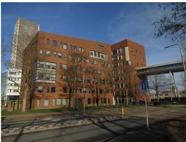
Abeelstr 1 B

Het verbindinggebouw naar Abeelstraat 3 tref ik daar wel aan. Het is een ontwerp van architectenbureau van Tilburg en Partners uit Rotterdam en met dit verbindingstrugetje zijn we dan terecht gekomen in de Abeelstraat waar we op nr. 1a, 3 en 5 enkel gebouwen van Van Tilburg en Partners aantreffen.