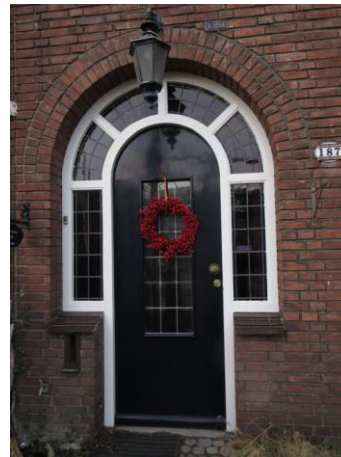
Ringbaan West 181 D

Ook het volgende rijtje van vijf, nr. 181 tm 189 is gebouwd door Joh. Appels, ook in 1937. Hier hebben de beide eindwoningen een dwarskap gekregen en toch is het geen symmetrisch rijtje geworden. De linker woning heeft niet het schuine dakje dat de erkers van de andere woningen verbindt. Dit heeft Appels hier gecompenseerd met een extra schoorsteen en een balkon op de erker. Mooie huizen.