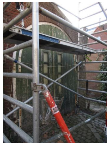
Palmenstr 6 B

En dan weer aan de andere kant Palmenstraat nr. 6, 4 en 2, nog drie vooroorlogse woningen. Ze zijn in 1938 gebouwd door Sprangers Bouw- en Betonbedrijf uit Breda. Met mooie getoogde garagedeuren. Die van 6 lijkt nog origineel.