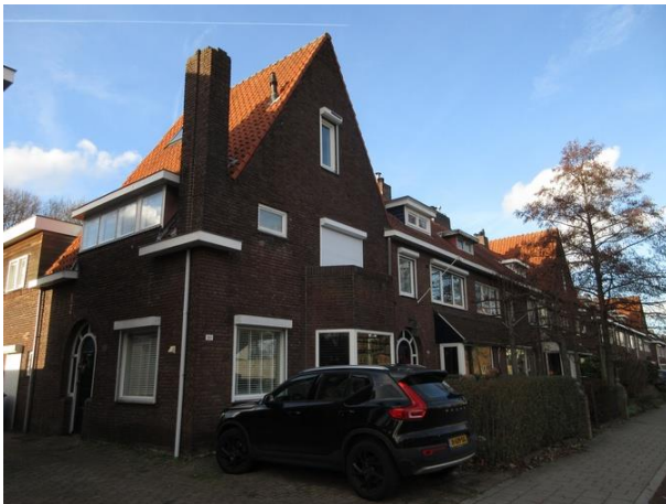
Ringbaan West 189-181

Nr. 171 tot en met 179 zijn vijf woningen gebouwd en ontworpen door aannemer Joh. Appels. Het rechtse huis heeft een dwarskap en de voordeur in de zijgevel. Gebouwd in 1937.