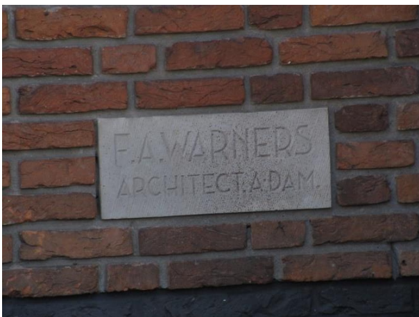
Ringbaan West 240 Ds1