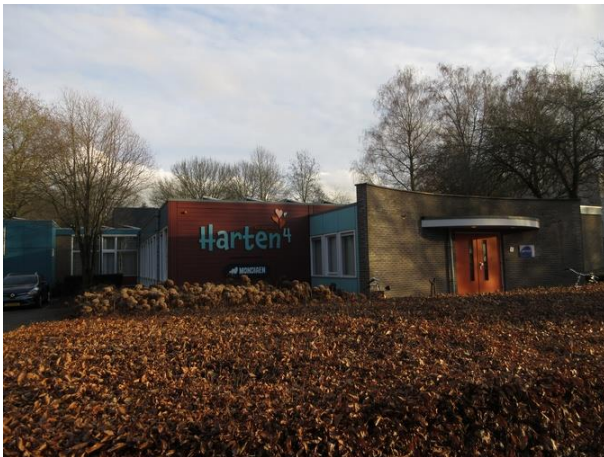
Cederstr 4 A

We lopen langs de galerijkant van de flat langs het fietspad en zien daar aan de overkant op nr. 2 een van de in 1970 gebouwde standaard gymnastieklokalen die de gemeente zo her en der verspreid over de stad heeft laten bouwen. Het ontwerp is van de Koninklijke Heidemij.