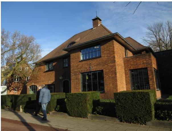
Ringbaan West 240 A

In 2010 zijn de nummers 242 en 240 door een nieuw verbindinggebouw aan elkaar gekoppeld. Ze bieden nu onderdak aan een assurantiekantoor. De architect van het tussengebouw is Willie Crox. Voor de glazen gevel zijn, ik denk bij wijze van zonwering, schanskorven gevuld met brokken donkergroen glas gezet.