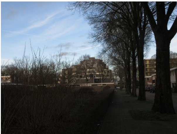
Rijtse Akkers C

We kijken recht vooruit waar ons oog getrokken wordt door een hoop appartementen die in hun geheel een rommelige indruk maken. Hier is in 1981 een woongebouw neer gezet dat aan het strakke regime van de jaren zestig is ontsnapt. Het bouwarchief laat er niet veel over los.