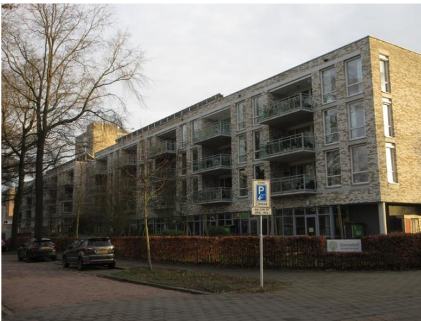
P Gimbrèrelaan 90 A

Vervolgens wandelen we door en langs de gebouwen van het in 2013 totaal vernieuwde woonzorg-centrum Zonnehof, Prof. Gimbrèrelaan nr. 24. Er is in de architectuur geprobeerd door wisseling van hoogtes en het maken van binnenhoven het grootschalige karakter van het centrum te temperen. Het hele gebouw is opgetrokken in een baksteen waarvan wij de kleur discutabel vinden. Het is de genuanceerde kleur van wit en zacht geelgrijs dat doet denken aan bakstenen met een zoutuitslag. Het gebouw is ontwikkeld door TBV-wonen en ontworpen door I.A.A. Architecten in Enschedé.