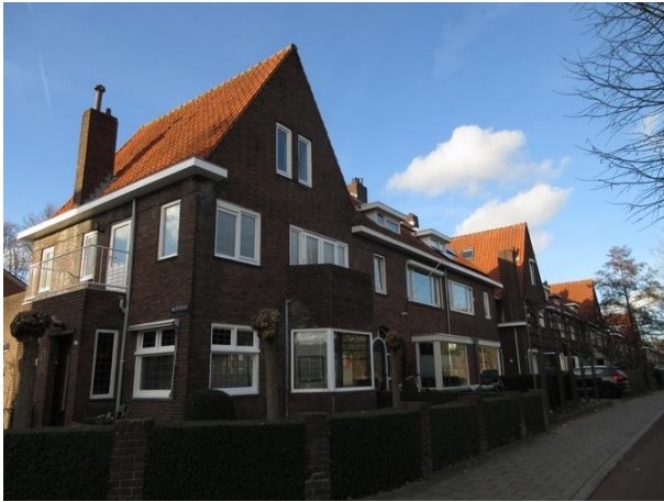
Olijfstr 1-Ringbaan West 191