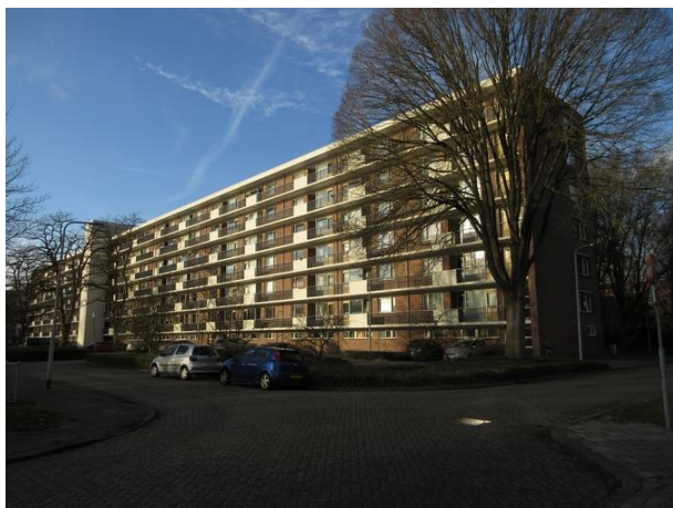
Prof Cobbenhagenlaan 10-204

Ook hier zijn op sommige plaatsen de borstweringen tussen de boven- en benedenramen die oorspronkelijk in verticale latten waren uitgevoerd veranderd in baksteen. De dakopbouwen van 30 en 28 (1996) volgen de architectuur van de onderliggende gevels. Ze geven het antwoord op de vraag die we net stelden. Als dakopbouwen toegelaten worden welk type heeft dan onze voorkeur?