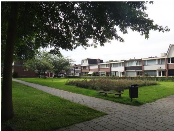
Prof Gimbrèrelaan 27-41 groen (foto 2014)

We gaan linksaf de Limbastraat in. Weer de tweelaagsewoningen type D van Groosman, nr. 1 tm 19, tien woningen die ook onderdeel uitmaken van een plan van in totaal 130 woningen, gebouwd in 1961. Hier zijn de borstweringen nog van plaatmateriaal of latten. We zien geen baksteen. De dakopbouw van nr. 5 dateert van 2005. Die van 11(2006), 15 en 17 (beide 1994) volgen de architectuur van de ondergevel.