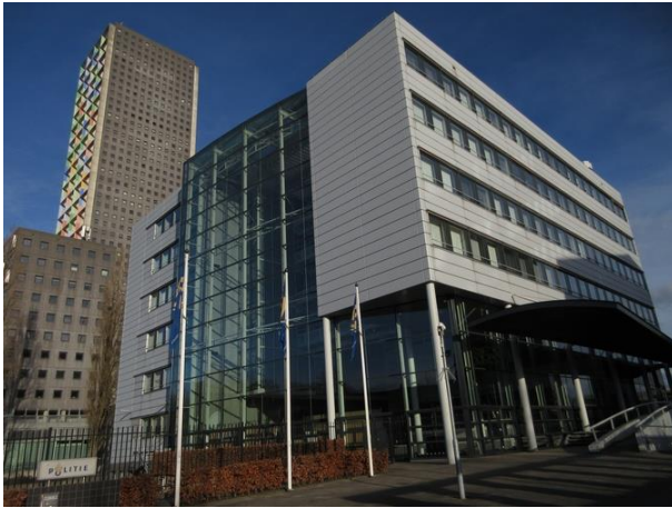
Ringbaan West 232