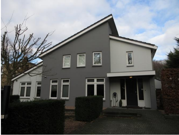
St Oloflaan 9

Nr. 9 is een woonhuis gebouwd in 1978. H. Leferink uit Goirle was de architect. Er is onlangs wat aan verbouwd en geschilderd. We zeggen er niet veel van.