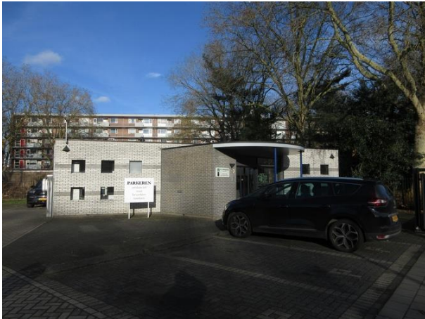
Palmenstr 7 B

We gaan terug via de overkant. Nr. 7 is in 1994 gebouwd. Een tandartsenpraktijk, een ontwerp van Van der Veen bureau voor architectuur Delft. Noem je dit postmodern?