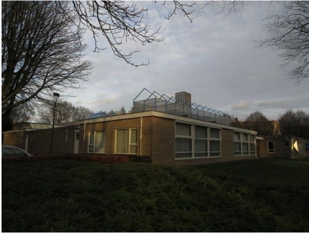
St Oloflaan-Prof Gimbrelaan 16 A

Via de Academielaan waar we nog een oud stukje Zonnehof zien lopen we terug naar de St. Oloflaan. Het oud stukje Zonnehof gaat hier ook de hoek om. Het gaat om een gebouw van 58 aanleunwoningen die alle in 1990 gebouwd zijn onder architectuur van Architectenburo Willem van Asten in opdracht van de Vereniging Volkshuisvesting Tilburg. Mooie appartementen met een mooie baksteen. Zo ga je graag de hoek om.