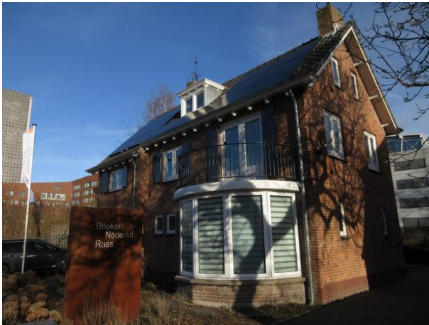
Ringbaan West 238

huis dat hij in 1919 in Berkel-Enschot realiseerde. Een romantisch huis een beetje in de stijl vergelijkbaar met het huis Beijers Keunen dat Bedaux in dezelfde tijd aan de Bredase weg bouwde. Mooie gevelsteen, stalen ramen en aan de onderkant van de gevel, iets terugliggend een plintje van donkere stenen. Het huis straalt er nog steeds mooi bij met uitzondering van het dak. Hier hebben de leipannen plaats moeten maken voor goedkope asfalt-shingles niet passend bij het huis en de gebruikers. Noblesse oblige! Het huis plaatsen we wel op onze HIPlijst.