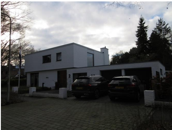
St Oloflaan 2

Vandaag beginnen we in de St. Oloflaan, op nummer 2 om precies te zijn.