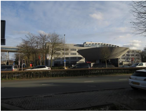
Ringbaan West 236 A

zo lezen we in de wervende gebouwbeschrijving op de website van Inbo. Het bouwarchief geeft ook hier niet thuis. Het heeft blijkbaar niets met verzekeringsgebouwen.