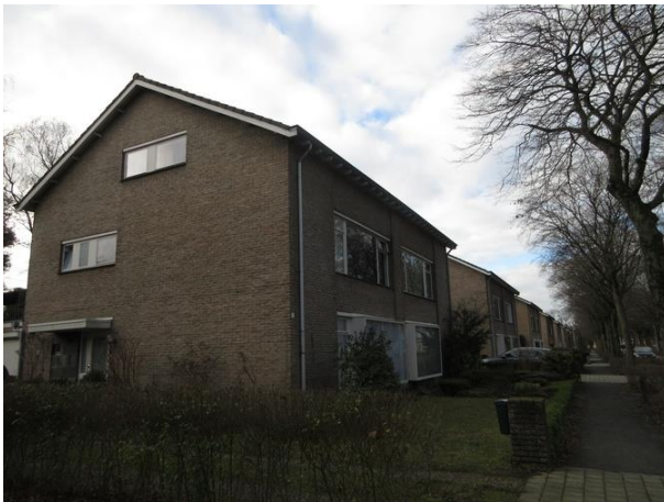
St Oloflaan 8-26