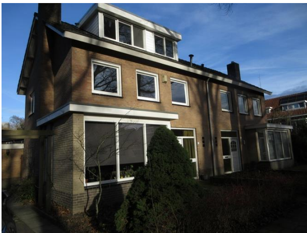
Prof Gimbrèrelaan 1a-1

Nr. 7, 5 en 3 zijn drie woningen in 1964 gebouwd in opdracht van de Gemeente Tilburg. Architectenburo Mijland verzorgde hier de architectuur. De verticale strepen van grijs sierbeton links van de voordeur lijken overbodige accenten.