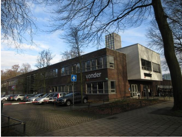
Prof Gimbrèrelaan 9

Nr. 9 is een ROC-schoolgebouw dat in 1999 gebouwd is. Architectenbureau Dré Storimans heeft het ontworpen op de herkenbare manier. Een rustig gebouw. Ad weet ons te vertellen dat het ROC voortaan Yonder heet.