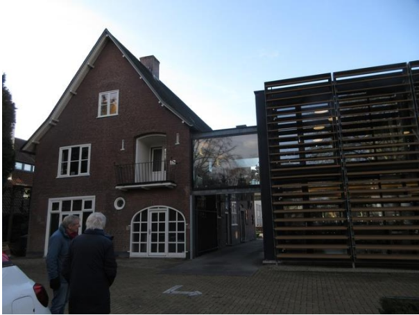
Ringbaan West 242-240 B Achterzijde