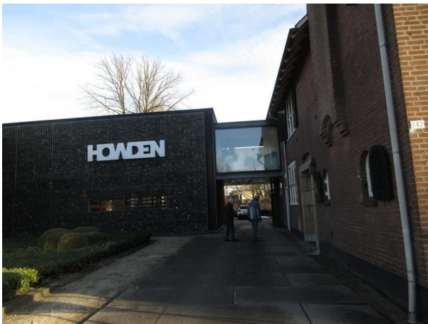
Ringbaan West 242-240 A