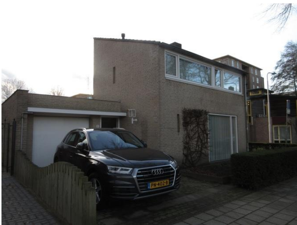
Prof Gimbrèrelaan 12