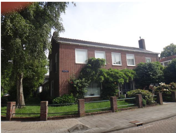
Olijfstr 3 (foto 2014)