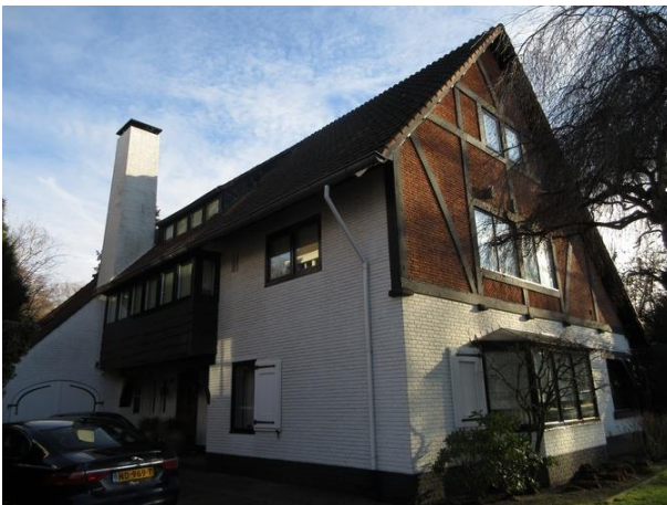
Ringbaan West 244