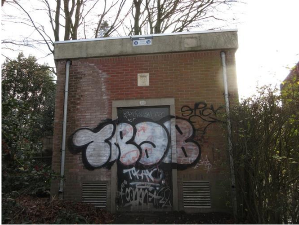
Prof Gimbrèrelaan 8

Op nr. 10 stond onlangs nog een huisje dat in 1962 gebouwd was als tuinderswoning met bedrijfsruimte, een ontwerp van Eduard van der Valk. Het pand heeft sinds vorig jaar plaats moeten maken voor een twee-onder een kapwoning, een ontwerp van Aerde Borgert Architecten.