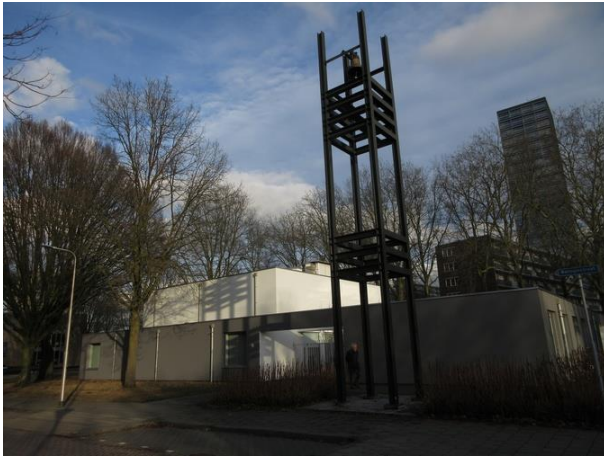
Prof Cobbenhagenlaan 8 B

We kijken nog even richting de Prof. Cobbenhagenlaan en zien daar op nr. 8 de Opstandingskerk. We schreven er een moNument over, nr. 377: