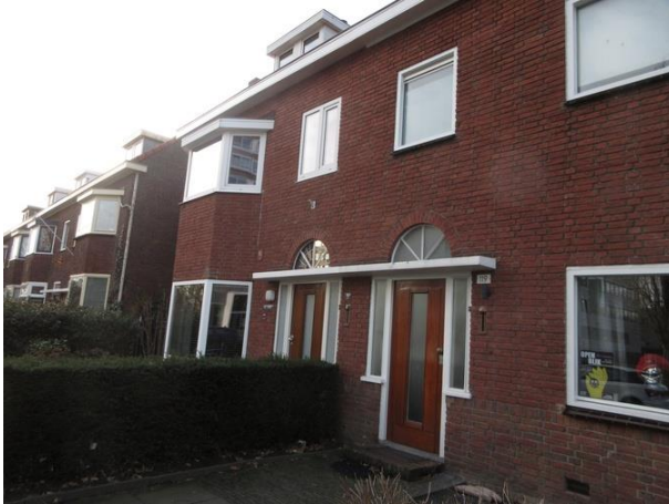
Ringbaan West 119-125