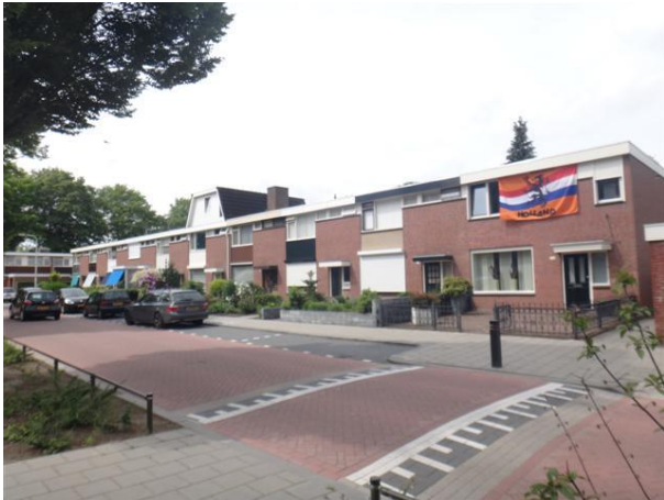
Waringinstr 13-31 (foto 2014)

We steken het fietspad over en gaan rechtsaf de Tamarindesraat in. We beginnen achteraan op nr. 12 en lopen zo terug naar nr. 2. In totaal 6 woningen die onderdeel uit maken van een bouwplan voor 130 woningen. Ook weer van de NV Mij. voor Stadsontwikkeling en architect E.F. Groosman. Gebouwd in 1961. We kwamen dit type vandaag al eerder tegen, het type van de verticale schrootjes. Nr. 2 heeft in 2003 een dakopbouw met lessenaars dak gekregen een dakvorm die afwijkt van de platte daken die heel deze wijk kenmerken. 'Moet je in zo'n strak geregisseerd bouwplan aan individuele wensen van uitbreiding tegemoet komen en, als je daar dan ja op zegt, moet het dan op deze manier, is de vraag die bij ons opkomt.