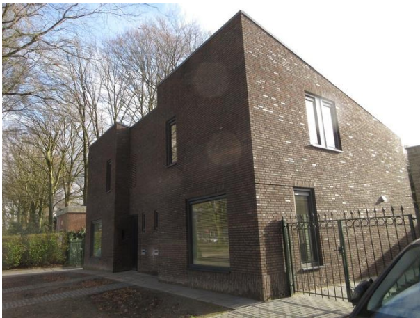
Prof Gimbrèrelaan 10a-10

We gaan de Prof. Gimbrèrelaan in, rechts op nr. 12, een van de zes Bedauxwoningen.