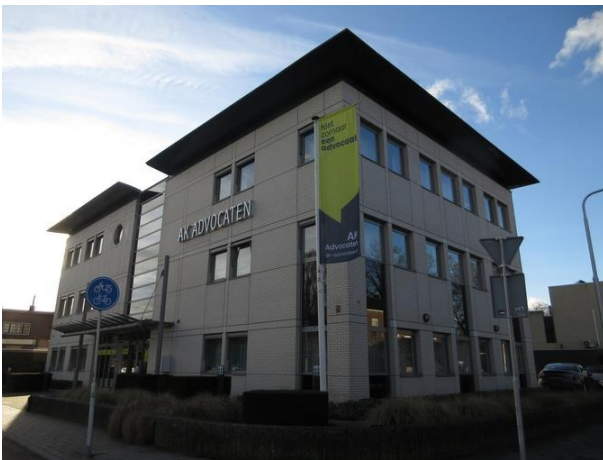
Ringbaan West 195 A