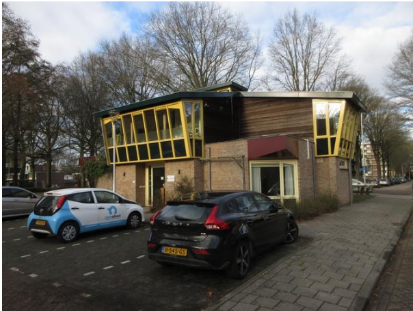
Cornelstr 1 B

En dan een stukje verder op nr. 1 is het niet meer 'denken aan', nee, dit gebouw draait er niet om heen, het is gebouwd in de antroposofische stijl en Pierre van der Geld laat zien dat hij dat kan. TIWOS is ook hier de opdrachtgever, een praktijkgebouw voor De antroposofische Gezondheidszorg Tilburg, gebouwd in 1996. Ondertussen is er een huisarts in het pand gevestigd. Toch veel onrust in de gevels.