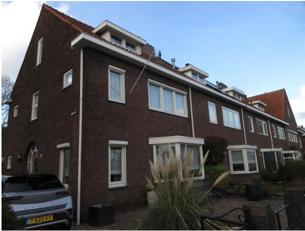
Ringbaan West 179-169

Nr. 171 tot en met 179 zijn vijf woningen gebouwd en ontworpen door aannemer Joh. Appels. Het rechtse huis heeft een dwarskap en de voordeur in de zijgevel. Gebouwd in 1937.