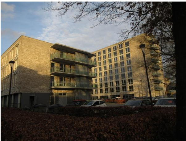
St Oloflaan-Prof Gimbrèrelaan 20-100

Vervolgens wandelen we door en langs de gebouwen van het in 2013 totaal vernieuwde woonzorg-centrum Zonnehof, Prof. Gimbrèrelaan nr. 24. Er is in de architectuur geprobeerd door wisseling van hoogtes en het maken van binnenhoven het grootschalige karakter van het centrum te temperen. Het hele gebouw is opgetrokken in een baksteen waarvan wij de kleur discutabel vinden. Het is de genuanceerde kleur van wit en zacht geelgrijs dat doet denken aan bakstenen met een zoutuitslag. Het gebouw is ontwikkeld door TBV-wonen en ontworpen door I.A.A. Architecten in Enschedé.