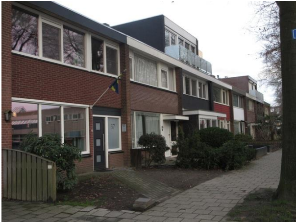
Prof Gimbrèrelaan 57-43

We gaan links af de Palissanderstraat in. De Maatschappij voor Stadsontwikkeling gaat nog even door met zijn 130 woningen, nu hier met negen woningen van het type C, nr. 2 tm 18. Niemand heeft het hier gedurfd om het regime van Groosman te doorbreken met een dakopbouw. Ook deze straat dateert van 1961.