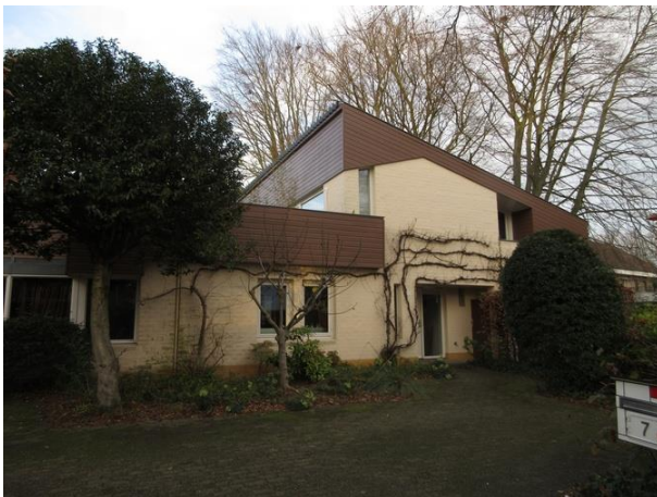
St Oloflaan 7

Het reliëf 'Apocalyps' is aangebracht op de westkant van een klooster en is een gemeentelijk monument. Het kunstwerk flankeert het trappenhuis van het Klooster van de Dochters van O.L. Vrouw van het H. Hart. Het 20 meter hoge reliëf is in opdracht van de congregatie, bij gelegenheid van de uitbreiding van het klooster in 1967, in beton uitgevoerd door priester-kunstenaar Egbert Dekkers (1908-1983). Deze studeerde monumentale kunsten aan de Rijksacademie in Amsterdam. Dekkers heeft eerst in tempex een negatieve vorm gemaakt, om deze daarna in beton te kunnen gieten. Na uitharding zijn de verschillende delen tot één geheel samengebracht. Het kunstwerk verbeeldt een passage uit het Bijbelboek Openbaring ofwel Apocalyps, dat vertelt over het einde der tijden. Dan zal de strijd tussen goed en kwaad gestreden worden en God het laatste oordeel vellen. Centraal staat het visioen van de vrouw: "En er verscheen een groot teken aan de hemel. Een vrouw bekleed met de zon, de maan onder haar voeten en op haar hoofd een kroon met twaalf sterren". De vrouw overwint het kwaad, zoals Maria ook Jezus de Messias heeft gebaard tot verlossing van de wereld. Met de vrouw van de Apocalyps heeft Dekkers op adequate wijze de patrones van de congregatie geëerd.