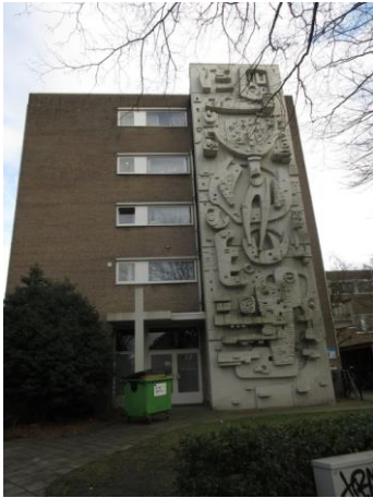
Bredaseweg 291 D

Aan de overkant zien we op nr. 1 een indrukwekkend kunstwerk waaraan wij eerder een moNument (nr. 376) aan wijdden. Ik citeer: