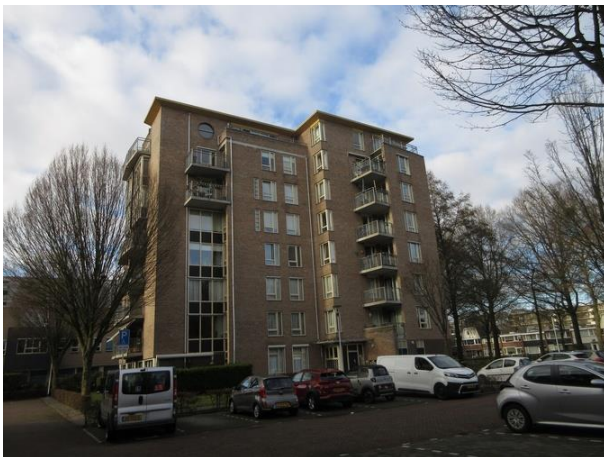
Cornelstr 3-61 B