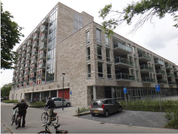
P Gimbrèrelaan 20-100 Zonnehof A (foto 2014)