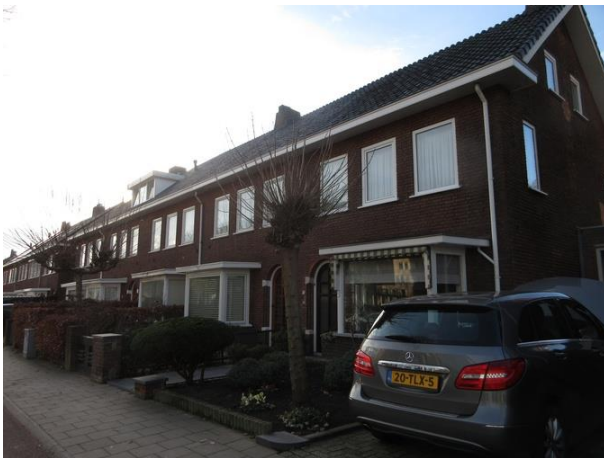
Ringbaan West 131-141

De woningen van Sprangers van 1938 worden hier vervolgd. In totaal waren het 23 huizen, dus hebben we er hier nog zes te gaan: 121 tm 129. Het eerste huis heeft helemaal geen erker gekregen. De rest wel, boven en onder. Het eerste blok heeft nog halfronde bovenlichten boven de voordeuren bij het tweede blok zijn de bovenlichten rechthoekig geworden.