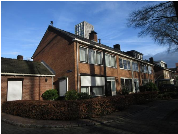
Prof Gimbrèrelaan 7-3

Nr. 9 is een ROC-schoolgebouw dat in 1999 gebouwd is. Architectenbureau Dré Storimans heeft het ontworpen op de herkenbare manier. Een rustig gebouw. Ad weet ons te vertellen dat het ROC voortaan Yonder heet.