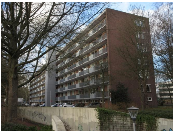
Cederstr 7-157 B

We lopen het stukje Ringbaan terug en slaan links af de Cederstraat in.