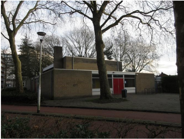
Cederstr 2 Sporthal

We lopen langs de galerijkant van de flat langs het fietspad en zien daar aan de overkant op nr. 2 een van de in 1970 gebouwde standaard gymnastieklokalen die de gemeente zo her en der verspreid over de stad heeft laten bouwen. Het ontwerp is van de Koninklijke Heidemij.