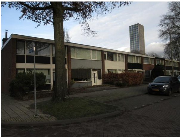
Prof Gimbrèrelaan 25-11

Op. nr. 8 een in 1961 gebouwde traforuimte van het Gemeentelijk Energiebedrijf. Publieke Werken mocht ook deze keer voor het ontwerp zorgdragen.