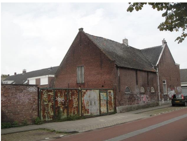
Bieuwstr 174 Da

Nr. 174 is de boerderij op de hoek. Deze stond er al eerder dan het bouwarchief werd opgericht, toen nog een eenlaagse gevel met de deur in het midden. De bijbouw aan de rechterkant stond er ook al. De oudste gegevens uit het archief zijn van 1914 toen er door N.Q. Priems iets aan de grote schuur direct achter de boerderij werd aangebouwd. In 1935 heeft B. Priems in de bijbouw een melkwinkel aangebracht, aan de linkerkant