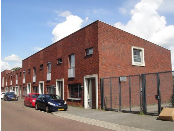
R Claeszenstr 32-12

Dan neemt DeZwarteHond de straatregie weer over met zijn 92 woningen- en 18 appartementenplan, gebouwd in 2005. Hier, aan de rechterkant, met elf woningen op nr. 32 tm 12. Eerst vier woningen met lijsten rond de voordeuren, dan drie woningen met lijsten rond de woonkamerramen en tot slot nog eens vier woningen met omlijste slaapkamerramen.