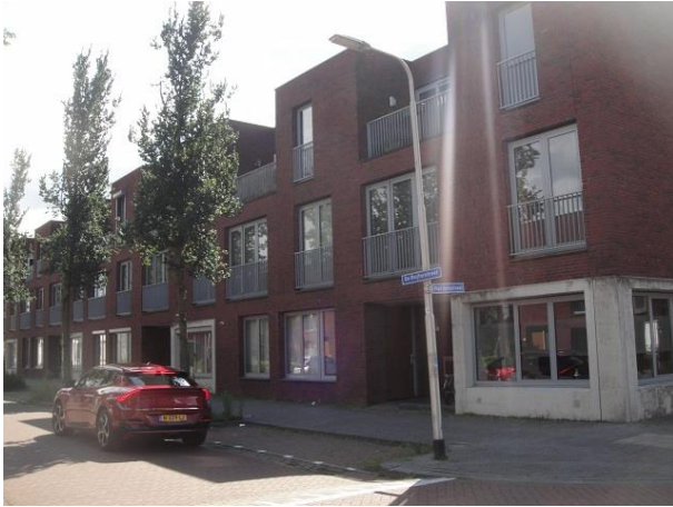
De Ruyterstr 35-39

We steken de Piet Heinstraat over en gaan daar weer verder met het plan van DeZwarteHond en TIWOS. Dit zullen de 18 appartementen zijn: De Ruijterstraat 35, 37 en 39 en Veestraat 129 en 131-01 tm 131-07 en 133-01 tm 133-07. Ook hier weer de rode baksteen, grijze puien, met af en toe een betonnen omlijsting. Bouwjaar 2005.