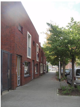
P Vroomansstr 12-20

'In drie fasen zijn de kleine eengezinswoningen vervangen door meer stedelijke woonvormen in een ruimere stedenbouwkundige opzet. Door op enkele plekken gestapelde bouw toe te passen is een hoge woningdichtheid verkregen. Bestaande en nieuwe pleinen en plantsoenen tussen de bebouwing zijn door groene straatprofielen met elkaar verbonden. In het centrum van de Zeeheldenbuurt is een plein met speelvoorzieningen gemaakt voor de door Joseph en Pierre Cuypers jr. ontworpen Gerardus Majellakerk (1923). Aan het plein liggen een Multifunctionele Accommodatie (MFA) en drie appartementsgebouwen. Alle bebouwing in de wijken is opgetrokken in een rode baksteen. De MFA is met een bruine steen de enige uitzondering. Terugliggende delen in dit gebouw en in de appartementsgebouwen zijn uitgevoerd in wit pleisterwerk, waardoor een plastisch beeld ontstaat. De eengezinswoningen in de wijken kenmerken zich door een afwisseling van liggend en staand metselwerk en betonnen lijsten rondom deuren en ramen.'