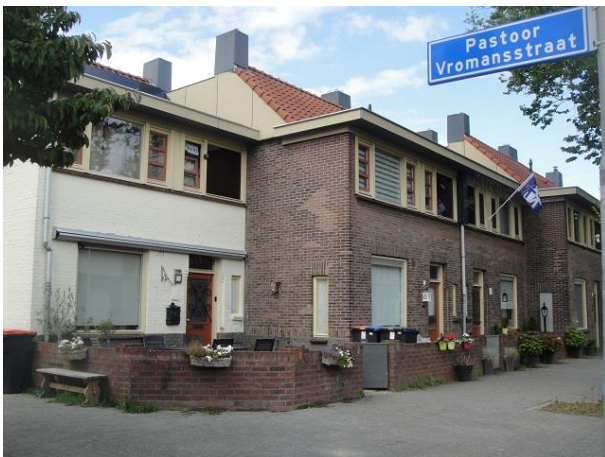
De Ruijterstr 31-27

En dan, linksaf de hoek om, in de Pastoor Vroomansstraat op nr. 3 en 1, een vervolg van het 69-woningenplan. Dit zijn waarschijnlijk de andere twee winkelhuizen in het plan geweest.