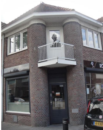
Nieuwstr 124 D en Ds