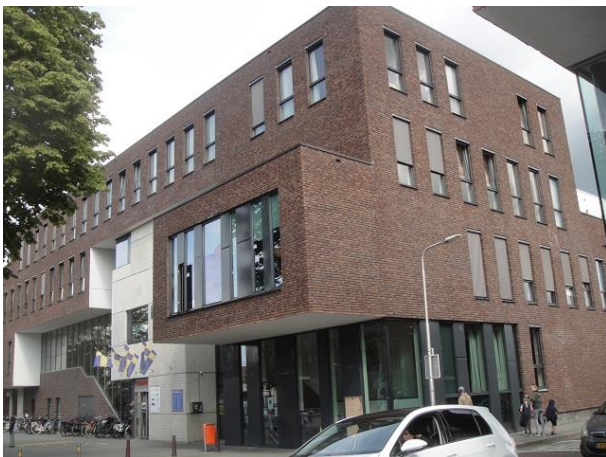
Wassenaerlaan 36 A

En Atelier Pro gaat nog verder. De Trompstraat gaat over in een soort plein met sport- en speelveldjes. De linkerwand van dit plein heeft dit architectenbureau mogen invullen met een appartementengebouw dat onderdak biedt aan 27 adressen: Wassenaerlaan 35-01 tm 35-08, 37-01 tm 37-08, 39-01 tm 39-08 en 41, 43 en 45. Ook weer samen met TIWOS.