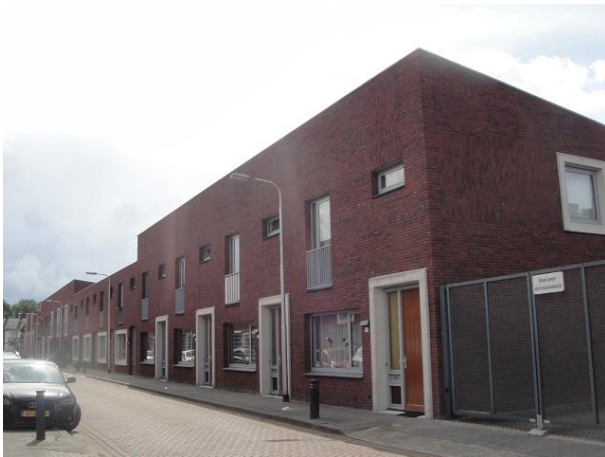
R Claeszenstr 13-37

Dan neemt DeZwarteHond de straatregie weer over met zijn 92 woningen- en 18 appartementenplan, gebouwd in 2005. Hier, aan de rechterkant, met elf woningen op nr. 32 tm 12. Eerst vier woningen met lijsten rond de voordeuren, dan drie woningen met lijsten rond de woonkamerramen en tot slot nog eens vier woningen met omlijste slaapkamerramen.