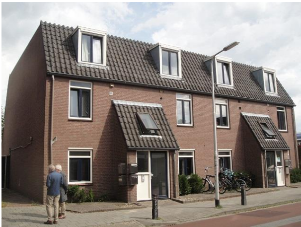
Trouwlaan 188 a-h