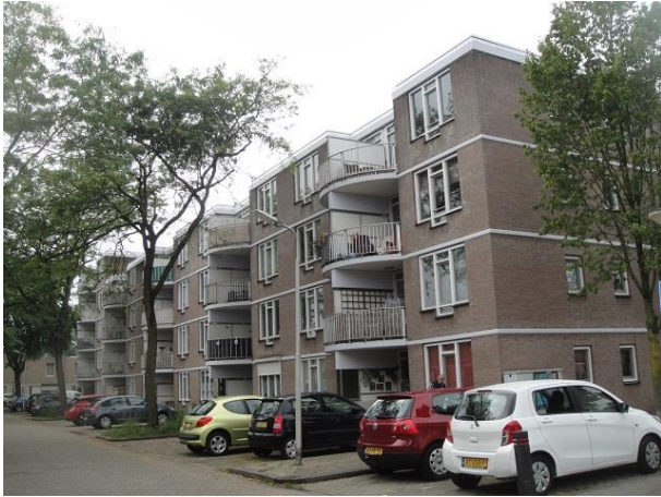
Zenikestr 2-178 A

We kijken terug naar rechts en zien daar aan de overkant een woningbouwcomplex van in totaal 89 appartementen, gebouwd in vijf en gedeeltelijk in vier lagen met aan de kant van de parkeerplaats de galerijkant en aan de andere kant, aan de Debijestraat en Zernikestraat, de mooiere kant, met ronde balkons. Het bouwjaar is 1986, een ontwerp van Van Oers Samenwerkende Architecten en de opdrachtgever is Stichting Bijzondere Woningbouw in Amersfoort geweest. Het adres is Zernikestraat nr. 2 tm 178.