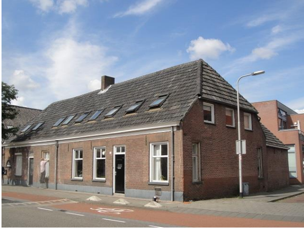
Oerlesestr 79 (-87)

Dan slaan we rechtsaf en komen we zo weer in de Oerlesestraat.