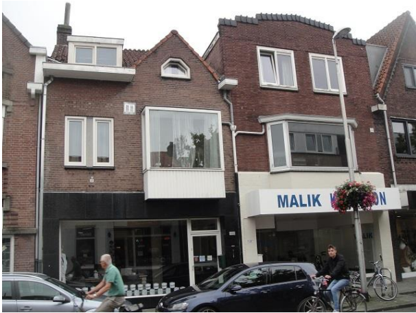
Korvelseweg 108 b-c