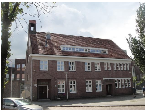
De Ruijterstr 33