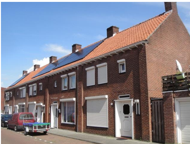
R Claeszenstr 42-34