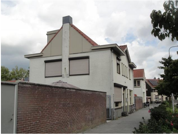
P Vroomansstr 3-1

lang geleden weer 'gefatsoeneerd'. Hier in deze straat nog eens 12 woningen, nr. 8 tm 30.