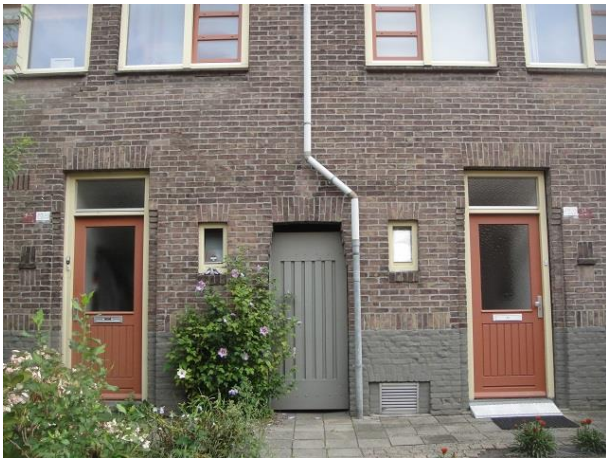
Trouwlaan 124-126 D