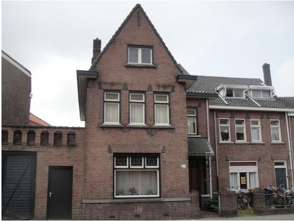
Trouwlaan 91 b