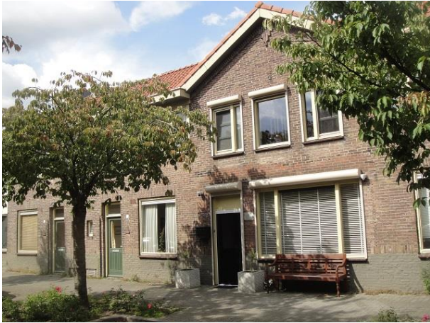
P Vroomansstr 13-15

We gaan linksaf de Pastoor Vroomansstraat in. Hier wordt het bouwplan van Meijnsing op nr. 21 tm 7 voortgezet met nr. 21 dat de Trouwlaanrij afsluit of begint en nr. 19 dat hetzelfde doet met de Pastoor Vroomansrij, beide huizen staan dwars op de achterliggende rij en zijn later, waarschijnlijk bij het optrekken van de gevels wit geschilderd. Op nr. 13 zien we een van de vier winkelhuizen die het plan kent. De drie ramen boven hadden oorspronkelijk geen onderverdeling. De verdeling die we nu zien is er bij de laatste renovatie in gemaakt, rond 2008. Beneden zat de winkeldeur oorspronkelijk in het midden tussen twee ongeveer vierkante etalageramen. We gaan via de overkant terug. Hier zien we weer woningen van het plan Herstructurering Uitvinders- en Zeeliedenbuurt waar we de vorige verkenning ook al mee kennis gemaakt hebben. In opdracht van Tiwos zijn op basis van een stedenbouwkundig plan van De Zwarte Hond uit Rotterdam twee volksbuurten geherstructureerd. Ik citeer uit de Architectuurgids Midden Brabant 2011: