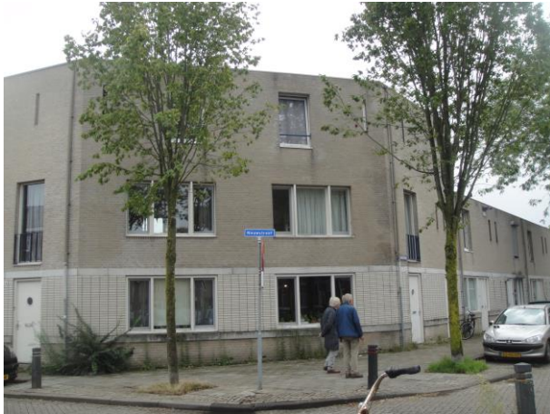
Nieuwstr 192-Debijestr 2

We lopen terug en gaan rechtsaf de Debijestraat in waar we aan de linkerkant op nr. 6 tm 20 nog eens acht woningen van het Amfasplan zien: Publieke Werken, Bedaux Architecten, 1986.