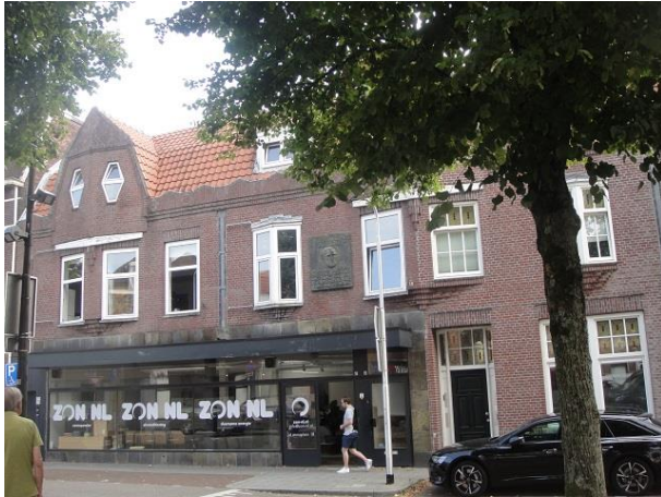
St Annaplein 18-19-20