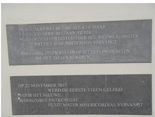
Oude Dijk 5Ds

Rechts zien we nog een ingang in de kloostergevel. Hier zat vroeger de RK Kweekschool Mater et Misericordia. Enkele jaren geleden is er een proces van ingrijpende herstructurering van de kloostergebouwen in gang gezet. Het in 1980 aan de Kloosterstraat gebouwde kloosterbejaardenoord Mater et Misericordia is inmiddels geheel gesloopt en vervangen door een nieuw gebouw dat op het adres Oude Dijk 5 is gerealiseerd en dat dezelfde naam heeft gekregen. Het is een kloosterverzorgingshuis voor de Zusters van Liefde. Het is een rustig ingetogen woongebouw geworden. Vier lagen hoog. De woningen kijken uit op een plantsoen waar aan de zuidkant het fraai pand Oude Dijk 9 is gelegen. Het plantsoen is hier kunnen ontstaan door het slopen van een lelijke witte sporthal die vanaf 1988 hier de straat heeft ontsierd.