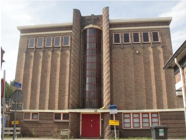
Oude Dijk 9 A