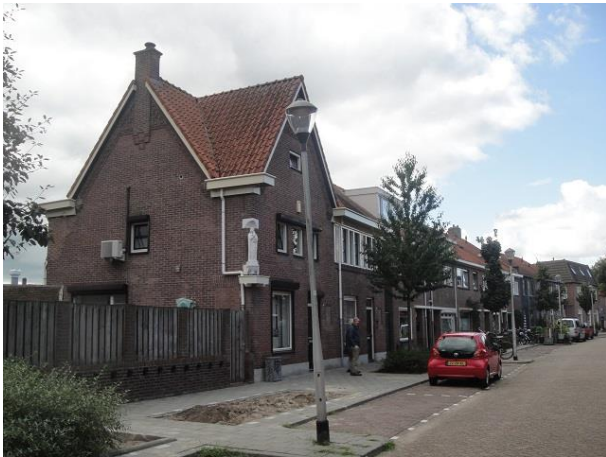
J vd Leestr 2-20

Nr. 15 werd in 1931 gebouwd door aannemer J. van Loon, beneden twee garages en boven twee werkplaatsen. In 1939 werd één garage omgebouwd tot ijssalon. In 1987 werd het pand woning en kreeg het een voordeur. Rechts zit nog de garage.