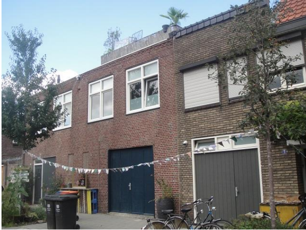
J vd Leestr 11-15

Nr. 15 werd in 1931 gebouwd door aannemer J. van Loon, beneden twee garages en boven twee werkplaatsen. In 1939 werd één garage omgebouwd tot ijssalon. In 1987 werd het pand woning en kreeg het een voordeur. Rechts zit nog de garage.