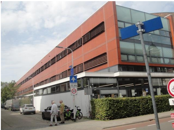
B Zwijsenstr 11C

We lopen voorbij delen van het zojuist beschreven Kunstcluster en slaan dan rechtsaf de Stadsstraat in.