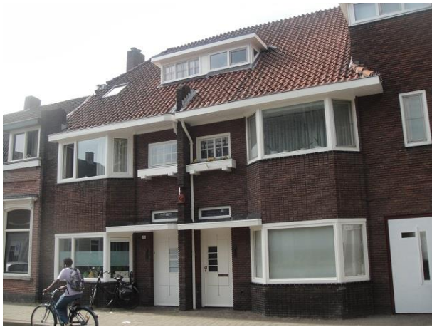
B Zwijzenstr 49-51