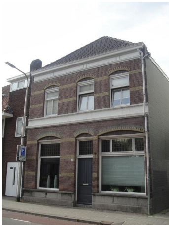
B Zwijzenstr 47