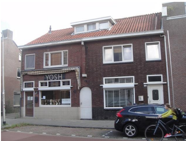
Trouwlaan 40 e-f