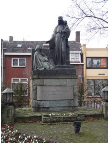
L Vrouweplein o (Foto's 2012)