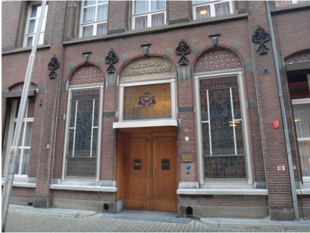
OudeDijk 1 D (foto 2013)