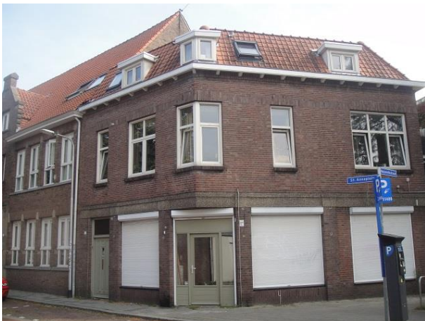
St Annaplein 23-24