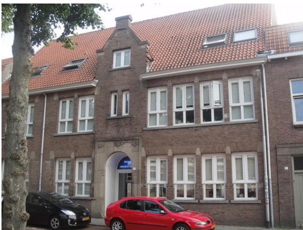
St Annaplein 21