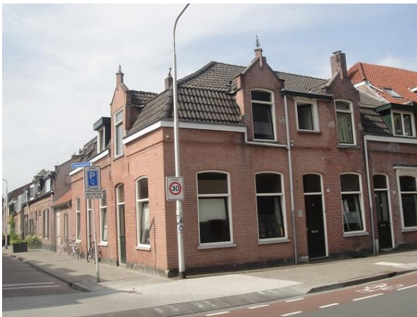
B Zwijsenstr 55

Nr. 4 tm 1 zijn ook tegelijk gebouwd, met een mansardekap. De dakkapellen zijn alle later toegevoegd.