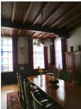
B Zwijsenstr 3 i 1 (foto 2013)

We gaan rechtsaf de Bisschop Zwijsenstraat in en treffen daar op nr. 3 een rijksmonument, de pastorie van het Heike. We bezochten 10 jaar geleden tijdens onze eerdere stadswandelingen deze pastorie en beschreven dat toen zo: ‘Omdat we vermoeden dat er binnen ook interessante zaken te zien zijn bellen wij aan. Kapelaan Karel Loots doet open en leidt ons enthousiast rond.’