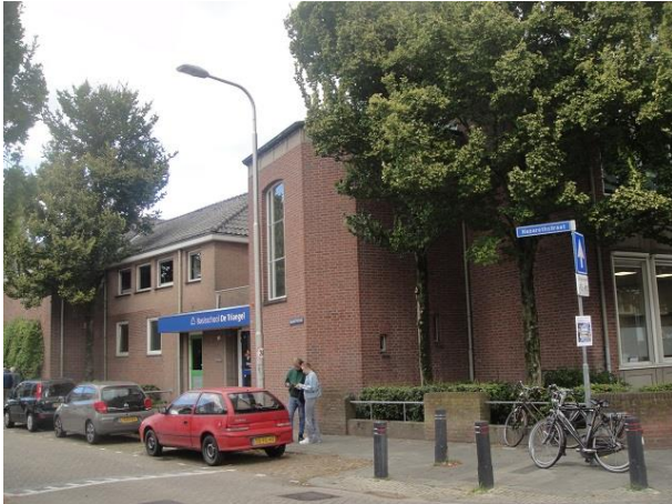
Nazarethstr 76 B