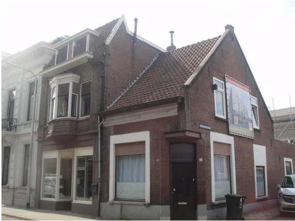
B Zwijzenstr 39-41