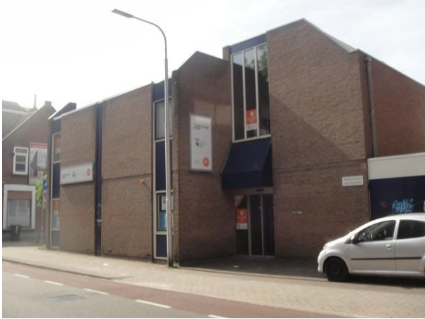
B Zwijsenstr 35

En dan zien we vervolgens de zijkant van een gebouw dat samen met ons linksaf de hoek omgaat en dat in de Bisschop Zwijsenstraat op nr. 35 zijn ingang en representatieve gevel heeft gekregen. Van Oers Samenwerkende Architecten ontwierp dit pand in 1977 voor een Dermatologisch Centrum. Nu zit er een huisarts en fysiotherapeut in, als ik het goed heb. We zien het levenloze metselwerk van de jaren zeventig, afgeschuinde hoeken om het gebouw wat te verzachten en blauwe verticale banen die de aandacht krijgen.