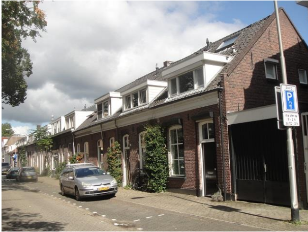
Oude Dijk 34-28

No. 34 tm 20 zijn acht woningen die eigendom zijn geweest van het kerkbestuur van de parochie 't Heike. Waarschijnlijk zijn ze in de 19 e eeuw ook door het kerkbestuur gebouwd maar daar vind ik in het archief geen bewijs van.