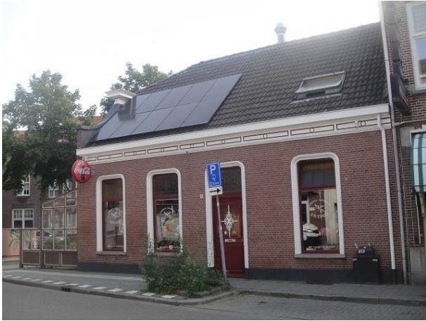
Korvelseweg 4 B