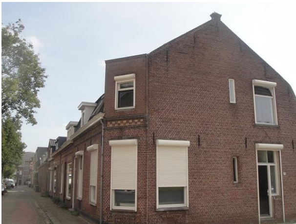
Stadstr 40-30-Oude Dijk 2k

Nr. 30 heeft zijn gevel in 1956 al opgetrokken terwijl hij de onderkant toen ongemoeid liet. In 1970 moest ook deze onderkant eraan geloven met de huidige gevel als resultaat. Nr. 32 verkeert op de dakkapel na nog in de oude staat. Nr. 34, 36 en 38 zijn gelijktijdig gebouwd, ook eind negentiende eeuw. Nr. 34 heeft in 1977 zijn raam vergroot. Nr. 38 deed hetzelfde al in 1972.