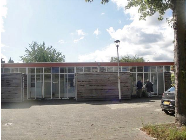
Trouwlan 39a (Dr Willem Dreeshof)