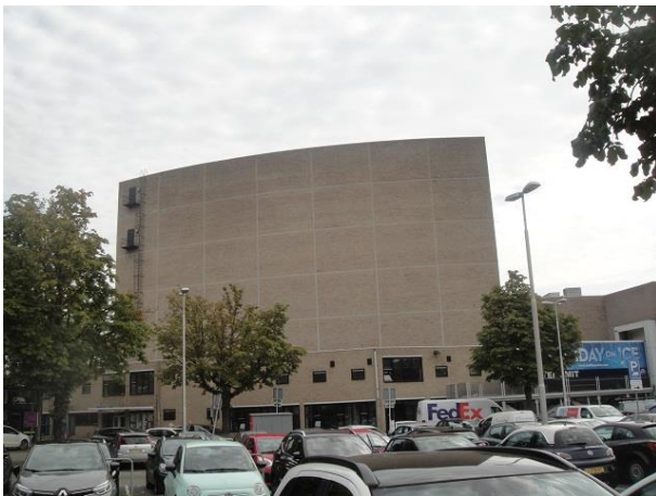
L Bouwmeesterplein B

Tegenover de ingang van de parkeergarage zien we een flatgebouw van vier lagen hoog, drie lagen woningen en op de begane grond winkels. Het pand heeft 39 adressen: Schouwburgring 4 en 6 en Louis Bouwmeesterplein 5, 6, 7, 8, 9, 10, 11, 12, 13, 14, 17, 18, 19, 20, 21, 22, 23, 24, 25, 26, 29, 30, 31, 32, 33, 34, 35, 36, 37, en 38. Dit flatgebouw is in 1962 gerealiseerd en bestond toen uit 12 winkels en 36 woningen. Centrale Opbouwbelangen Rotterdam was opdrachtgever en Ingenieurs- en Architectenbureau A.G. en J.D. Postma tekende voor het ontwerp, dat paste binnen het stedenbouwkundig plan van bureau Broek en Bakema uit Rotterdam.