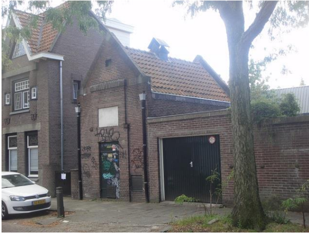
Nazarethstr 3 trafo