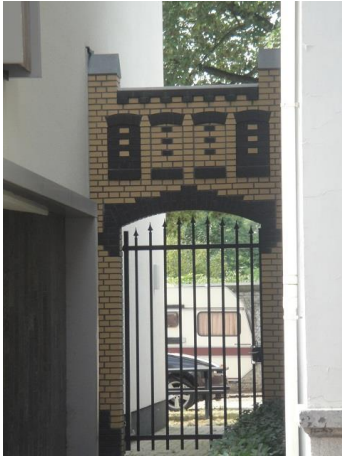
B Zwijzenstr 45 D

appartementengebouw gerealiseerd dat bijna in de rooilijn staat. (24 appartementen, nr. 45-01 tm 45-24).