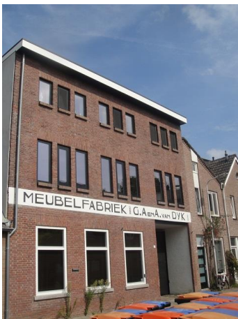
V Doorenstr 15