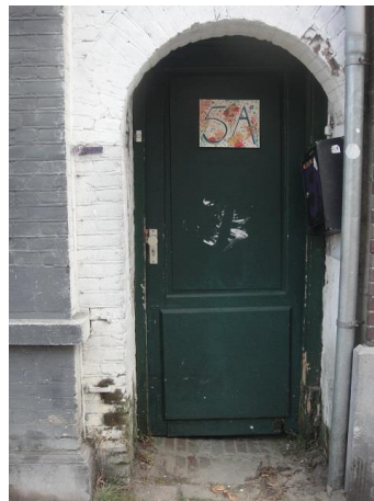
Lieve-Vrouweplein 5a D

We gaan naar het Lieve Vrouwenplein. Voorheen hoorde het bij het St. Annaplein maar in 1933 is het van naam veranderd.