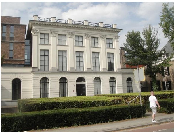
B Zwijsenstr 5

In de bijkeuken zien we nog een oude put.' De pastorie was eerst, vanaf 1797, gehuisvest geweest in het pand Bisschop Zwijsenstraat 22, een eindje verder aan de overkant, het pand dat in 1991 afbrandde en niet meer opgebouwd werd. In 1834 trok pastoor Zwijsen in zijn nieuwe pastorie op nr. 3. De straat heette toen nog Nieuwe Dijk. Een indrukwekkend huis, symmetrisch opgebouwd. De ramen met louverluiken roepen een Franse sfeer op, een groot leidendak met slechts een dakkapel en twee fraaie schoorstenen op de dakeinden. Links het koetshuis met opvallend hoge deuren en schoorsteen. Het mooiste huis van Tilburg? (We verwijzen hier nog naar moNument nr. 59 dat we hierover schreven).