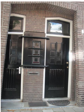
Nazarethstr 7 D