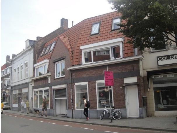
St Annaplein 14-15