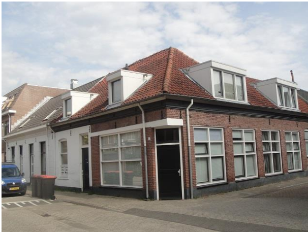
Oude Dijk 10-6

We lopen een eindje terug voor de overkant. Op nr. 2 zien we een in opdracht van de S.V.W in 1979 gebouwd woongebouw. De architectuur is van Tol en Tol Ingenieurs en Architecten uit Rotterdam. Wij noemden deze stijl van de jaren zeventig eerder 'Nieuwe Lelijkheid'.