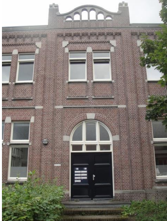
Nazarethstr 50-60 D

De hele verdere rechterkant van de Nazarethstraat (nrs. 50, 50a, 52 tm 64, 64a, 66 tm 74 en 20 tm 4) zijn gebouwen van Huize Nazareth geweest. Het hoofdgebouw werd in 1916 gebouwd en Jos. Donders was de architect. De Vereniging voor Liefdewerk voor Kinderbescherming was de opdrachtgever. De fraters van Tilburg vingen hier 'verlaten en misdeelde' kinderen op. In het linkerdeel van het hoofdgebouw werden de jongens ondergebracht met beneden eet- en recreatiezalen en boven de slaapzaal met 61 chambrettes van 1.80 x 1.60 m1.