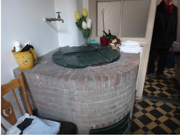
B Zwijsenstr 3 i 2 (foto 2013)

In de bijkeuken zien we nog een oude put.' De pastorie was eerst, vanaf 1797, gehuisvest geweest in het pand Bisschop Zwijsenstraat 22, een eindje verder aan de overkant, het pand dat in 1991 afbrandde en niet meer opgebouwd werd. In 1834 trok pastoor Zwijsen in zijn nieuwe pastorie op nr. 3. De straat heette toen nog Nieuwe Dijk. Een indrukwekkend huis, symmetrisch opgebouwd. De ramen met louverluiken roepen een Franse sfeer op, een groot leidendak met slechts een dakkapel en twee fraaie schoorstenen op de dakeinden. Links het koetshuis met opvallend hoge deuren en schoorsteen. Het mooiste huis van Tilburg? (We verwijzen hier nog naar moNument nr. 59 dat we hierover schreven).