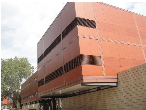
B Zwijsenstr 11 Stadsstr

Nr. 40 zal ook rond 1900 gebouwd zijn. Ook dit pand verkeert in grote lijnen nog in originele staat. Alleen de topgevel lijkt aan de bovenkant wat vereenvoudigd te zijn. We zijn op de Oude Dijk beland. En wie in Tilburg Oude Dijk zegt denkt aan de Zusters van Liefde.