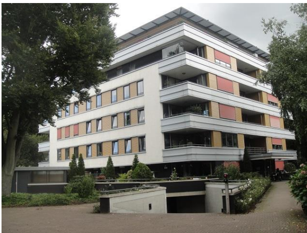
Nieuwstr 3 A

Op de hoek op nr. 39 zien we een oud pand, een voormalige slagerswinkel. Ik kom hier in 1926 een tekening van de etalage tegen die op naam staat van slager A. Brands. We lopen terug via de Varkensmarkt rechtdoor langs de lang muur van het Stadspark, vroeger de muur van de nonnen van de Oude Dijk. Is het de langste tuinmuur van de stad?