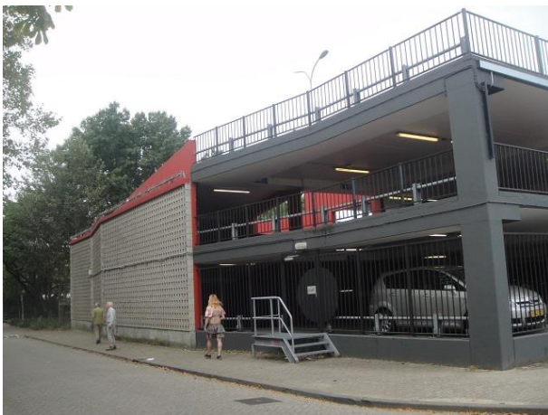
L Bouwmeesterplein D

We passeren een parkje met oude monumentale bomen en een fontein en zien dan de grijze wanden van de hier twee lagen hoge (met kelder drie lagen) parkeergarage met als adres Louis Bouwmeesterplein 2. Het bouwarchief zwijgt er over. De BAG geeft als bouwjaar 1985 op. Veel meer valt er niet over te vertellen. Aan de pleinkant is met het schilderen van het beton, voornamelijk in een zwarte kleur, geprobeerd het gebouw mooier te maken.