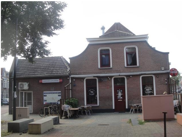
Korvelseweg 4 A

Het volgende pand is Café De Engel. Ook meer dan 100 jaar oud en nog in oorspronkelijke staat. Een heel mooi pand. Het heeft twee adressen, hier aan de Korvelseweg, nr. 4 en ook aan het St. Annaplein , en daar nr. 24 . Hier zien we een eenlaagse gevel met een zadeldak en aan de St. Annapleinkant een tweelaagse afgeknotte halsgevel. Ik zag een dergelijk pand ook wel als volgt beschreven: 'pand met ingezwenkte gevel onder afgewolfd zadeldak'. Ramen en deuren omkaderd door geprofileerde stuklijsten. Ook een plaats op onze HI lijst waardig. Op nr. 25 begon café de Engel in 1962 een automatiek. Tot dan was er een smederij gevestigd. De automatiek bestaat niet meer. De ruimte lijkt bij het naastgelegen cafetaria getrokken te zijn.