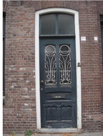
1 a D

We lopen terug naar nr. 1 en gaan daar linksaf de Trouwlaan in.