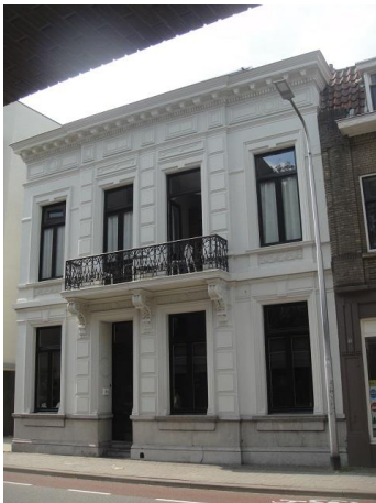
B Zwijzenstr 43

De twee poortjes die naast de oude City Bar gestaan hebben en die toegang gaven aan een oude school zijn op verzoek van de gemeente bij de bouw gespaard gebleven. De nieuwe 'stadsvilla' is met zijn vijf lagen hoger dan zijn omgevende bebouwing.