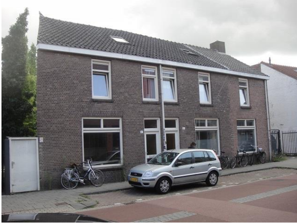
Trouwlaan 40 a-b