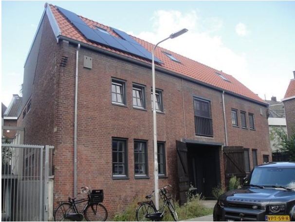
Trouwlaan 5 a-c