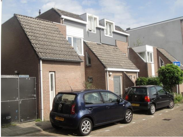
V Doorenstr 23-17