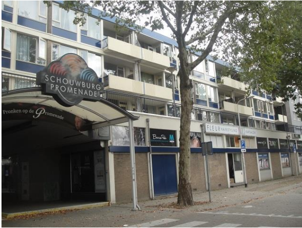
L Bouwmeesterplein 5-38

Tegenover de ingang van de parkeergarage zien we een flatgebouw van vier lagen hoog, drie lagen woningen en op de begane grond winkels. Het pand heeft 39 adressen: Schouwburgring 4 en 6 en Louis Bouwmeesterplein 5, 6, 7, 8, 9, 10, 11, 12, 13, 14, 17, 18, 19, 20, 21, 22, 23, 24, 25, 26, 29, 30, 31, 32, 33, 34, 35, 36, 37, en 38. Dit flatgebouw is in 1962 gerealiseerd en bestond toen uit 12 winkels en 36 woningen. Centrale Opbouwbelangen Rotterdam was opdrachtgever en Ingenieurs- en Architectenbureau A.G. en J.D. Postma tekende voor het ontwerp, dat paste binnen het stedenbouwkundig plan van bureau Broek en Bakema uit Rotterdam.