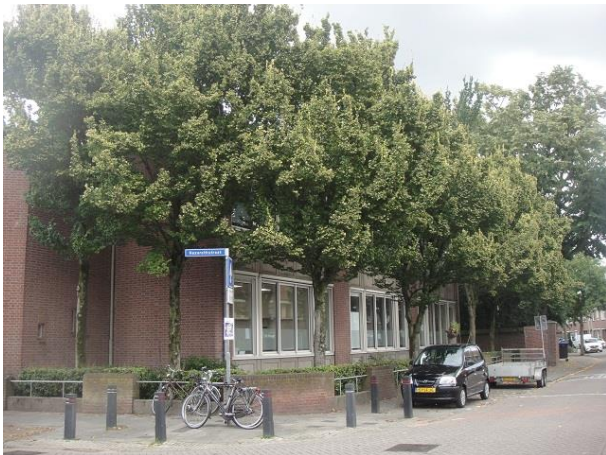
Nazarethstr 76 A

Dan zien we op de hoek met de Nazarethstraat en met het adres ook in die straat het schoolgebouw op nr. 76. 'Basisschool De Triangel' lezen wij boven de voordeur. Het is de voormalige BLOschool die oorspronkelijk bij Huize Nazareth hoorde, dat toen hier verderop in de straat gevestigd was. Het meest rechtse deel van de school, met een lange gevel aan de Nieuwstraat is gebouwd in 1951 onder architectuur van Architectenbureau C en F. van Meerendonk. F. van Meerendonk tekende ook in 1957 de gymzaal, het linkerdeel van de school (de kopgevel met een patroon van terugliggende bakstenen). Het middenstuk rond de ingang is in 1975 gebouwd met Heerkens als architect.