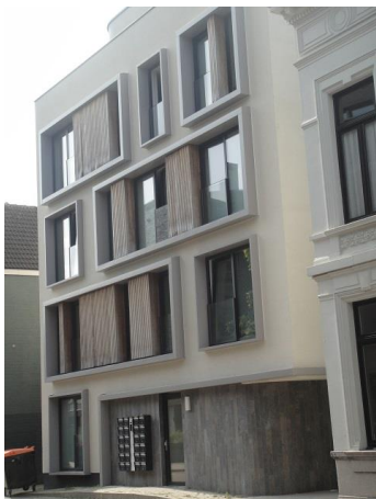
B Zwijzenstr 45