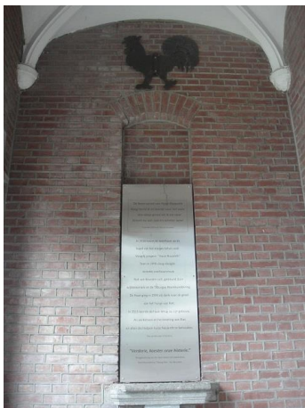
Nazarethstr 46 D1

Rechts waren de fraters gehuisvest, met beneden o.a. de kapel, de refter en de keuken en boven slaapkamers.