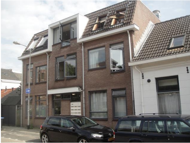
Oude Dijk 2

We lopen een eindje terug voor de overkant. Op nr. 2 zien we een in opdracht van de S.V.W in 1979 gebouwd woongebouw. De architectuur is van Tol en Tol Ingenieurs en Architecten uit Rotterdam. Wij noemden deze stijl van de jaren zeventig eerder 'Nieuwe Lelijkheid'.