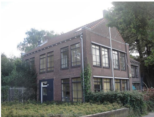
Nazarethstr 18 B

Met dit plan gaan we in de Nazarethstraat verder, nr. 41 tm 19, weer twaalf woningen met drie dwarskappen.