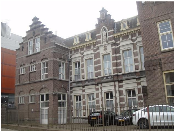
Kloosterstr 4 B

Onder deze brug heeft kunstenaar Judith Kuijpers drie nonnen in staal vereeuwigd (2009).