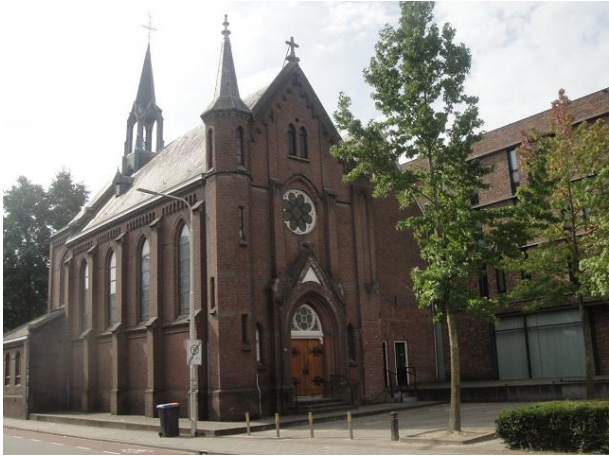
B Zwijsenstr 7