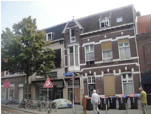
St Annaplein 17-16