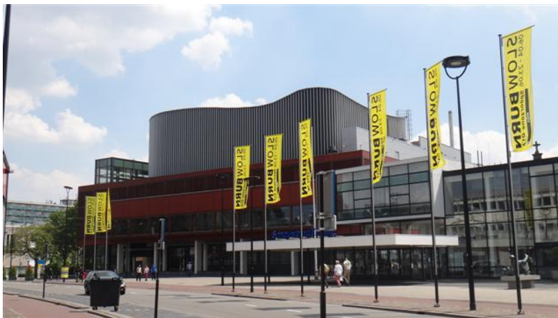
Zwijsenplein 1 (foto 2013)