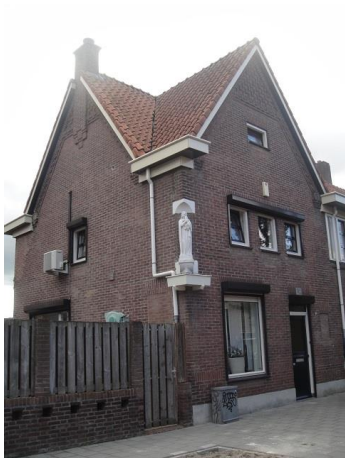
J vd Leestr 2