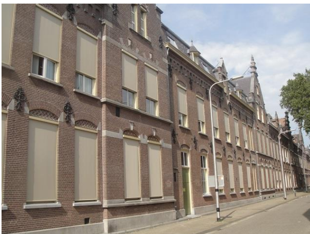
Oude Dijk 5

De kapel ligt achter de kloosterwand van de Oude Dijk, ervan gescheiden door een smalle binnenplaats. In de zogenaamde novicen vleugel van de kapel is het beeldenmuseum van zuster Jesualda Kwanten (1901-2001) gevestigd. In een van de kloostergangen is een portrettengalerij te zien van alle zusters die meer dan honderd jaar oud geworden zijn. Onder de meer dan dertig vereeuwigde eeuwigen hangt ook Jesualda die precies honderd jaar oud is geworden. De kloostertuin was tijdens ons bezoek, het zal een jaar of tien geleden zijn nog steeds wijds en bijzonder ondanks het feit dat de zusters een twintigtal jaren geleden een deel van de tuin hebben afgestaan aan de gemeente Tilburg, dat toen Stadspark is genoemd.