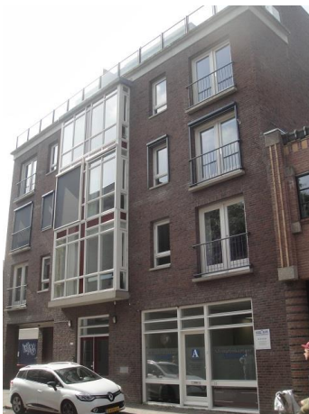
B Zwijsenstr 27-33

En dan zien we vervolgens de zijkant van een gebouw dat samen met ons linksaf de hoek omgaat en dat in de Bisschop Zwijsenstraat op nr. 35 zijn ingang en representatieve gevel heeft gekregen. Van Oers Samenwerkende Architecten ontwierp dit pand in 1977 voor een Dermatologisch Centrum. Nu zit er een huisarts en fysiotherapeut in, als ik het goed heb. We zien het levenloze metselwerk van de jaren zeventig, afgeschuinde hoeken om het gebouw wat te verzachten en blauwe verticale banen die de aandacht krijgen.