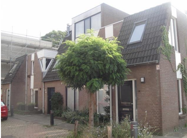
V Doorenstr 14-10

We lopen terug de Van Doorenstraat in waar de overkant nog op ons wacht. Eerst het diepe achterterrein van het gebouw op de hoek met amorfe bebouwing van tuinmuren en vervallen garages. De bebouwing is onlangs gesloopt en er zijn, als we het goed zien een vijf huizen in aanbouw.