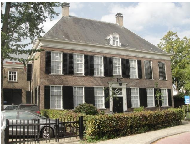
B Zwijsenstr 3