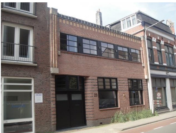
B Zwijsenstr 23

Nr. 33 is een royaal appartementengebouw van 4 lagen hoog, voor in totaal 8 woningen, gebouwd in 2002 en de architect was Ing. C. Struycken. Smulders de Wit Vastgoed was opdrachtgever. De erker valt op.