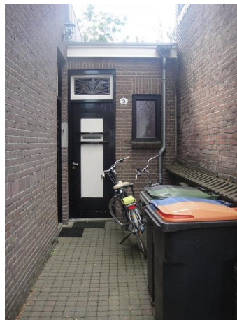
Nazarethstr 5 D

Nr. 5 en 7 zijn beide ontworpen door Bern. Simons, nr. 5 in opdracht van onderwijzer B. Velge en nr. 7 in opdracht van opzichter A. Arnold. Mooi hoe Simons bij beide huizen de daklijn doorbreekt met stenen dakkapellen, ieder huis zijn eigen ontwerp. Verassend zijn ook de kleine raampjes in het ronde metselwerk onder de dakkapel op no. 5. Nr.5 heeft als bouwjaar 1925, nr. 7, 1926. We plaatsen beide panden op onze HI lijst.