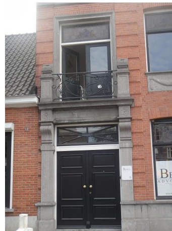
Lieve-Vrouweplein 9 D