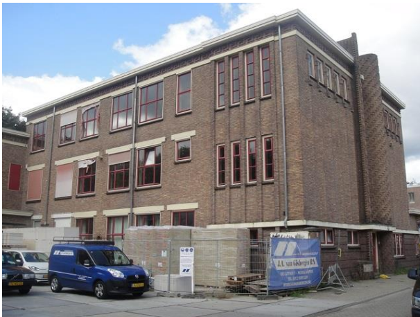
Oude Dijk 9 C

Oude Dijk 9 is het als Theresialyceum gebouwde pand van architect Jos. Donders, rijksmonument. In 1930 gebouwd, met golvend metselwerk, in de traditie van de Amsterdamse school. De van Doorenstraat geeft gelegenheid tot het nemen van afstand zodat je de schoonheid van het gebouw beter tot je kunt laten doordringen. We schreven er een moNument over, nr. 17: