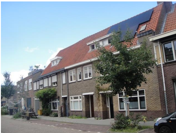
J vd Leestr 7-15