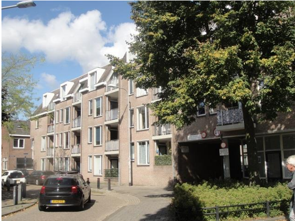
Nazarethstr 14 B