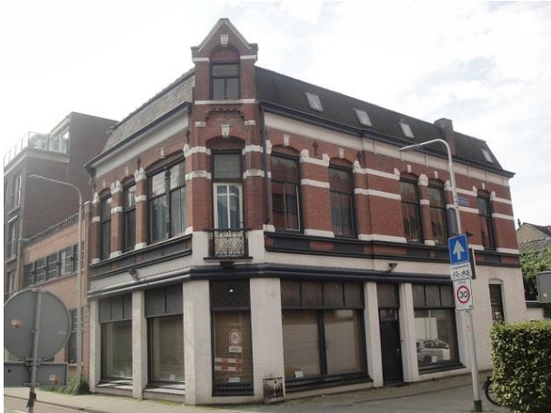
B Zwijzenstr 19