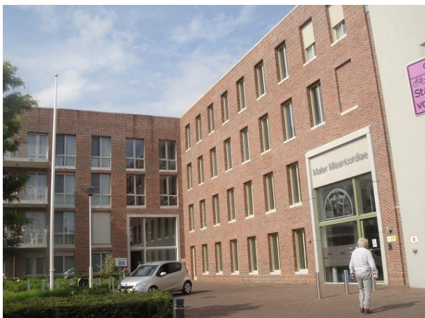
Oude Dijk 5-7