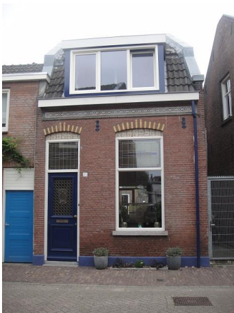
St Annastr 45