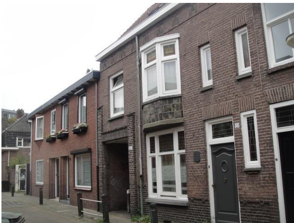
v Sonstr 33