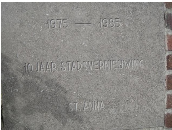
St Annastr 20 Dsh