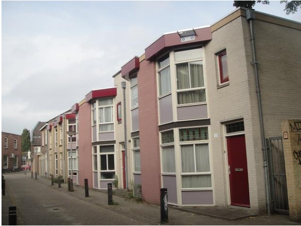
St Annastr 14a-2

Op nr. 14a, 12a, 10a en 8a zien we vier eengezinswoningen die als één bouwplan in 1986 zijn gebouwd door de combinatie Publieke Werken, Hurkmans en Kovos. Deze woningen hebben roze gevels. Op nr. 6a en 4a volgen dan nog twee woningen die ook één bouwplan vormden, ook van de combinatie PW, Hurkmans en Kovos zijn maar gele gevels hebben. Ook van 1986.