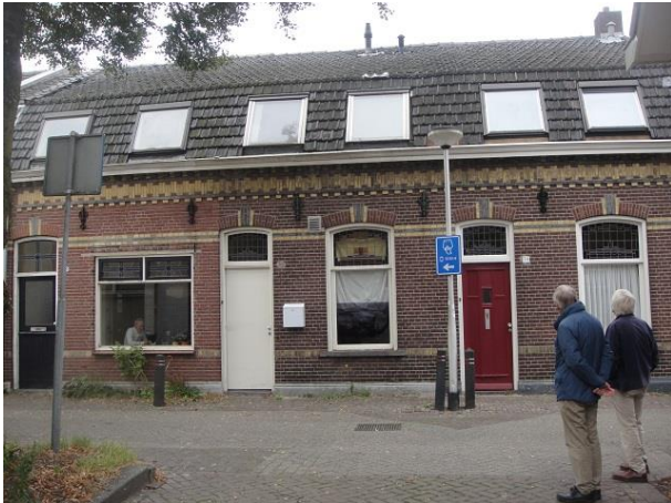
St Annastr 30-34

De gevelsteen naast de voordeur van 38 meldt dat de huizen van 1887 dateren.