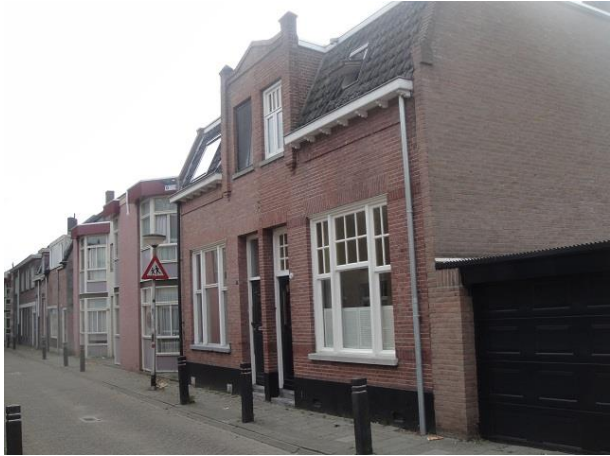
St Annastr 5-11a