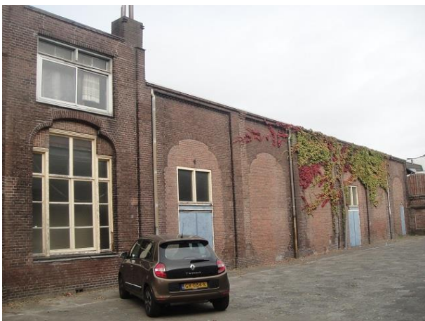
St Annastr 16 A

Links naast de school zien we nog het oude patronaatsgebouw, nu in gebruik als gymnastieklokalen.