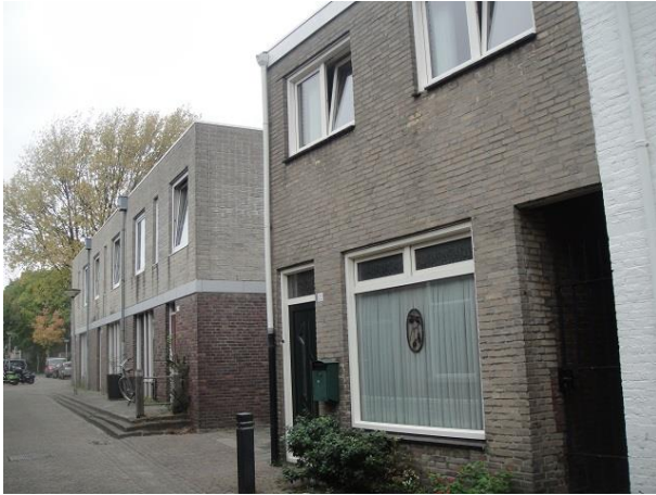
St Annastr 22-20u

Dan volgen drie huizen, nr. 20w, 20v en 20u die betrekkelijk nieuw zijn. Het hoekpand heeft zijn hoek net als alle andere panden in deze buurt afgeschuind maar verder heeft deze nieuwe bebouwing zich weinig aangetrokken van het bestaande. Het plan omvat zes gestapelde woningen gebouwd in 1984 in opdracht van Publieke Werken en is een ontwerp van Jo Hurkmans en de Stichting KOVOS uit Eindhoven. We zien tweekleurige gevels: een paarsbruine baksteen op de begane grond en iets van een licht grijze gebroken kalkzandsteen op de verdieping.