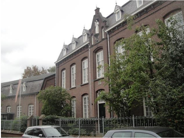
Capucijnenstr 76 B

We vervolgen onze weg langs de tuinmuur die nu een echte tuinmuur is totdat we op nr. 76 weer een rijksmonument tegenkomen: rechts het voormalig fraterhuis en links het voormalige jongensweeshuis Anthonius van Padua dat dateert van 1894 en is ontworpen door H. van den Abeelen. Achter het Fraterhuis de in 1933 gebouwde kapel van architect Constant Panis. Vanwege zijn heldere akoestiek is er nu een opnamestudio (Maarten Hartveldt, een naam die we net al tegenkwamen) in gehuisvest. Een mooi torentje bekroont een dak belegd met geglazuurde romaanse pannen. Links van de kapel en achter het weeshuis zijn in 1991 door de Vereniging Volkshuisvesting Tilburg 36 seniorenappartementen gebouwd die uitkijken op de nu openbare fraterstuin. (architect Pierre van der Geldt). (Frater Mattheushof 2tm 12, 14 tm 22, 24 tm37). In het weeshuis zit nu een steunpunt voor bejaarden (Frater Mattheushof nr. 1, 13 en 23) en in het klooster en de kapel zijn enkele bedrijfjes gehuisvest. (Capucijnenstraat 76, 76-01 tm 76-09 en Mattheushof 40 en 41).