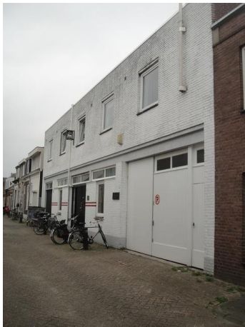
v Sonstr 30