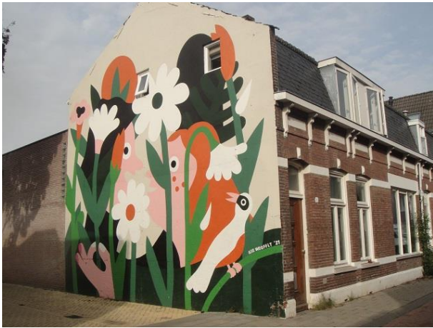
Capucijnenstr 61 K