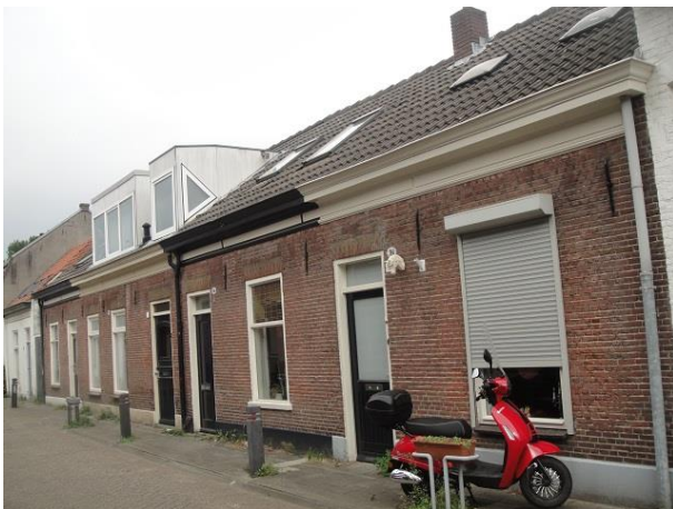
v Sonstr 16-10