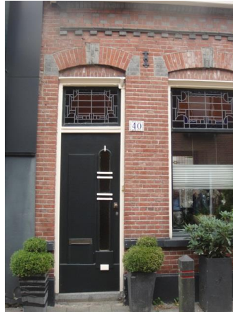
V Sonstr 40