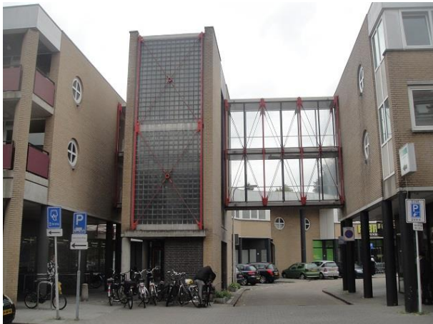
Korvelseweg 127-131 D

Dan zien we een vrij nieuw winkelcentrum, gebouwd in 1990, in opdracht van Nedmaco Eindhoven en het ontwerp is van Luijten Architectuur en Stedenbouw Hilvarenbeek.