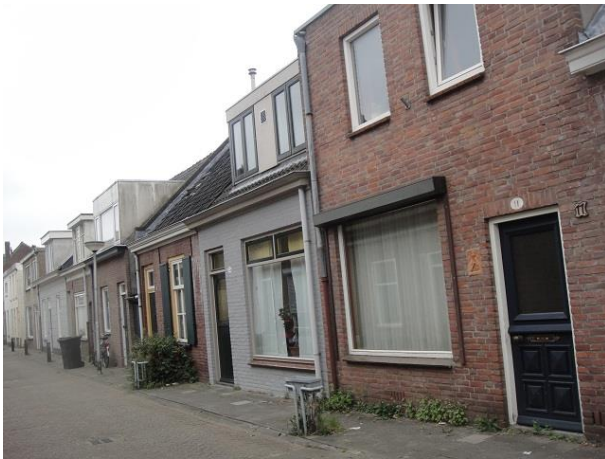
v Sonstr 11-19

Nr. 7 tm 15 zijn vijf eenlaagse huizen, ook negentiende-eeuws, waarschijnlijk alle even oud, met oorspronkelijk één raam in de gevel en een zadeldak. Nr. 7 heeft in 1978 zijn gevel vernieuwd (raam verbreed en deur ingekort) en twee losse dakkapellen gekregen. Deze zijn in 2014 aan elkaar gekoppeld. Nr. 9 heeft in 1979 zijn raam verbreed.