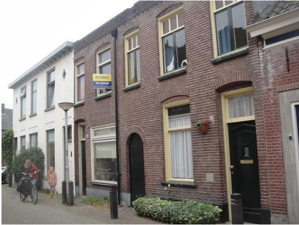
St Annastr 61-65