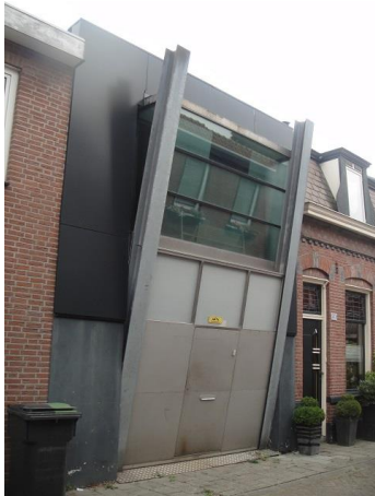
v sonstr 40