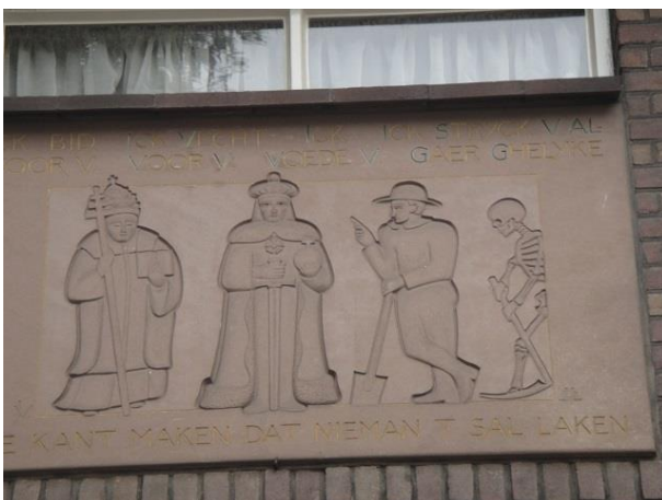
Schouwburgring 182 Dg