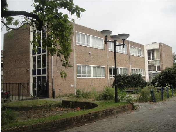
St Annastr 18-20 A

Op nr. 20 zien we een voormalig basisschool die als we het goed hebben op zijn laatste benen loopt of staat. De school kent een zeer lange geschiedenis. Ze zal ook dateren van eind negentiende eeuw, net als de kerk. In 1906 wordt de bewaarschool verbouwd tot jongensschool. De gevel waar we nu op kijken dateert van 1964. Ze is ontworpen door architect Van Boldrik uit Maarhees. De school heette toen de Joachimschool. De kinderen van Ad hebben er nog op gezeten.