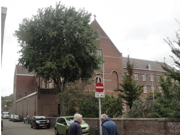
Korvelseweg 165-167 B