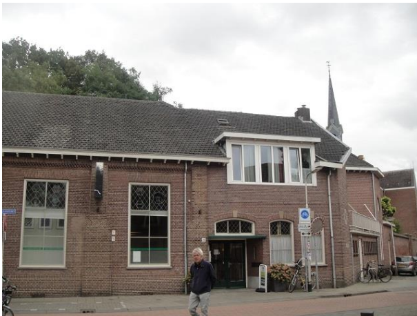
Capucijnenstr 78 A