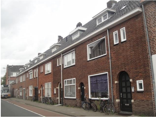
Lange Schijfstr 88-80

De vijf woningen met drie garages op nr. 88 tm 80 zijn gebouwd in 1938 door aannemer Joh. Appels; de handtekening van de architect is niet te ontcijferen. De woningen zien er nog redelijk uit, slechts een enkele heeft de kozijnen anders ingedeeld. Een mooie warme roodbruine baksteen, terugliggend gevoegd.