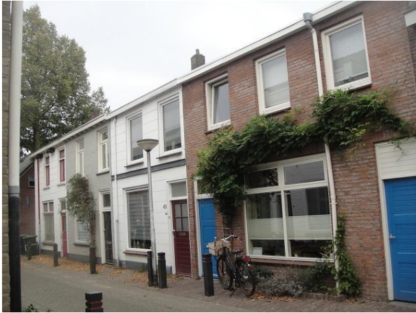
St Annastr 47-53