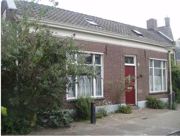
St Annastr 46