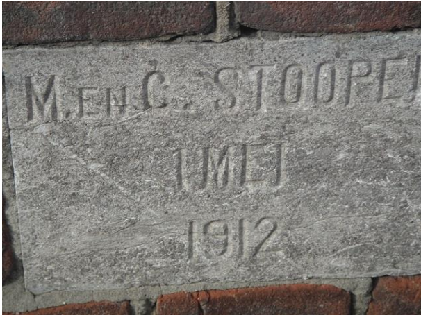
Capucijnenstr 61 Ds