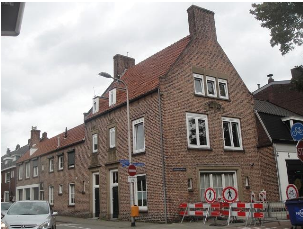
Lange Schijfstr 90-98

Nr. 15 en 16 zijn ook al lang bestaande panden die met regelmaat verbouwd zijn. Vanaf 1940 is hier de Firma van Tilburg bezig geweest, eerst met hun keukens en later met gereedschap.