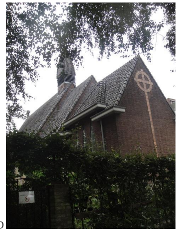
Capucijnenstr 76 KA en KD

Vormalige kapel, Frater Matheushof, 40 en 41