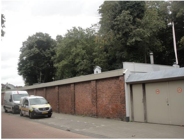
Capucijnenstr 78 C en D

Het gebouw werd ook gebruikt als retraitehuis. Rond 1980 werd het pand omgebouwd tot buurthuis van de wijk St. Anna. Maar het buurthuis verhuist in 1999 naar de Nieuwe Stede. Er komt dan een dierenkliniek in, die er nog steeds in gevestigd is. Een fraaie stijlvol ingerichte kapel maakt onderdeel uit van het gebouw. De Dogmatische Unie is hier gezeteld. (Paterstraat 50) Deze Unie is in 1980 in Tilburg opgericht. Zij opereert binnen de R.K. Kerk maar wil niets weten van de liturgische hervormingen van het tweede Vaticaanse Concilie.