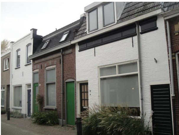
St Annastr 28-24

Dan krijgen we een rij van drie vrij authentieke huizen, nr. 34, 32 en 30 . Jammer dat no 30 met zijn vergrote raam eruit springt. In 1981 gaf de gemeente hier nog vergunning voor. Zou ze dat nu nog steeds doen? Het is wel netjes gebeurd, mooie huizen, met prachtig versieringen in het metselwerk. We maken er toch nog een HIP van.