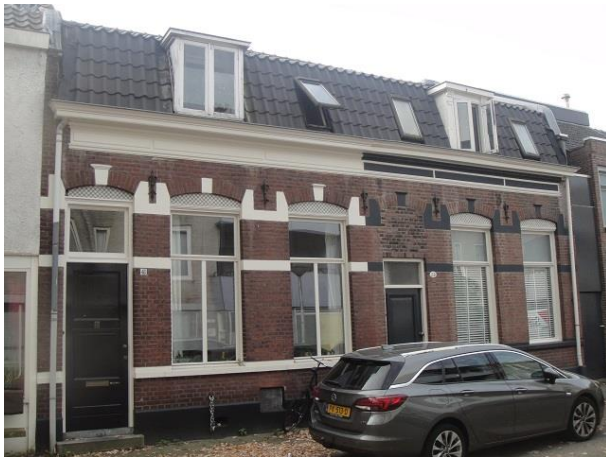
St Annastr 41-39

Nr. 39 en 41 zijn volgens het bouwarchief na de bouw eind negentiende eeuw niet meer veranderd, maar de voordeur van nr. 39 laat wel degelijk duidelijke verbouwingssporen zien. Verder zijn het nog mooie gevels en hebben ze nog fraaie dakkapellen.