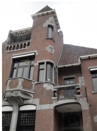
Zomerstr 17-47 D