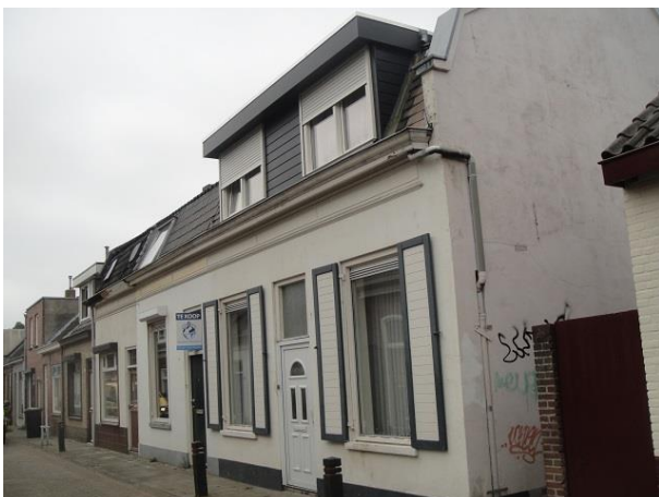
v Sonstr 1-7