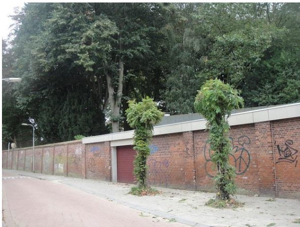
Capucijnenstr 78 E

We lopen langs de lange fraaie kloostermuur van de Kapucijnen tot we in de muur een deur met nr. 76a zien. Hier gebeurt blijkbaar wat anders dan een kloostertuin ommuren. En ook hier geeft het bouwarchief weer antwoord op onze vraag. In het verleden heeft de Stichting Don Bosco, afdeling meisjes, hier een eenlaags jeugdhuis genaamd 'Den Herd' gehad. In 1957 heeft Pater Hygimus, de directeur van de Stichting nog een vergunning gekregen voor een uitbreiding van het gebouwtje. Blijkbaar is het pand intussen van bestemming veranderd want in 2003 is er een vergunning gevraagd voor het bouwen van een zwembad achter de woning.