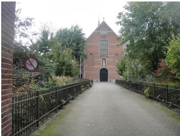
Korvelseweg 165-167 A

Hier schreven we moNumenten 198 (kapucijnenklooster) en 199 (kapel) over die we onderstaand citeren