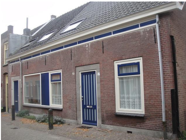
St Annastr 57-59

Nr. 51 en 53 hadden ook dezelfde eenlaagse gevels met zadeldak toen ze in 1923 door spinmeester Frits van der Linden tot tweelaags verhoogd werden. In 1964 werd bij nr. 51 het woonkamerraam verbreed, nadat dat al bij nr. 53 in 1960 gebeurd was.