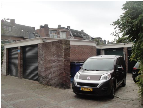
St Annastr 77-79