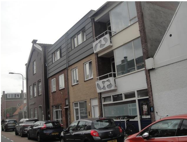
Lange Schijfstr 101-107