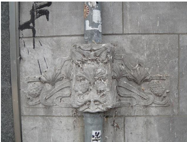
Zomerstr 17-47 Ds

We gaan rechtsaf, de Zomerstraat in. En daar is het voorbij de winkel van Mulders meteen raak. Nu een rijksmonument en weer beschreven in onze moNumentenserie, nr. 22. Ik citeer weer: