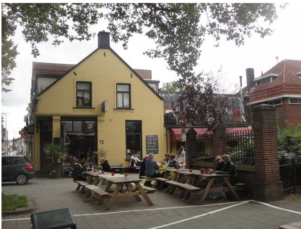
Korvelseweg 169 terras