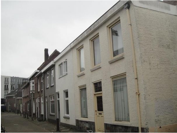
v Sonstr 25-31

Nr. 25 heeft in 1928 zijn gevel met een tweede laag verhoogd. De bovenkant was licht getrapd afgewerkt maar de trap is gesloopt of onder de gootlijst weggewerkt. De opdrachtgever was winkelier H. vd. Meijs.