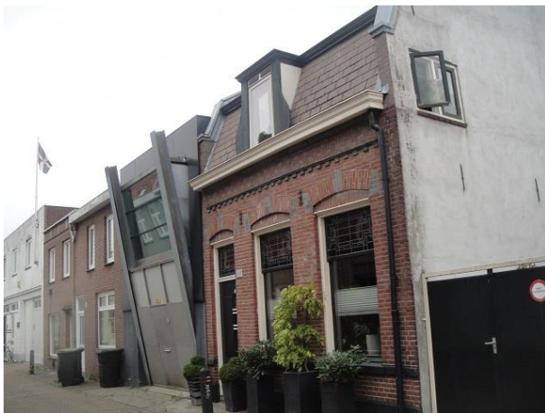
v Sonstr 40-34

Aan de overkant zien we achter het hoekhuis Korvelseweg 55 een in 1976 volgebouwde achtertuin, boven een uitbreiding van de woning en beneden een uitgebreide winkel, een ontwerp van L.P.M. de Graaf.