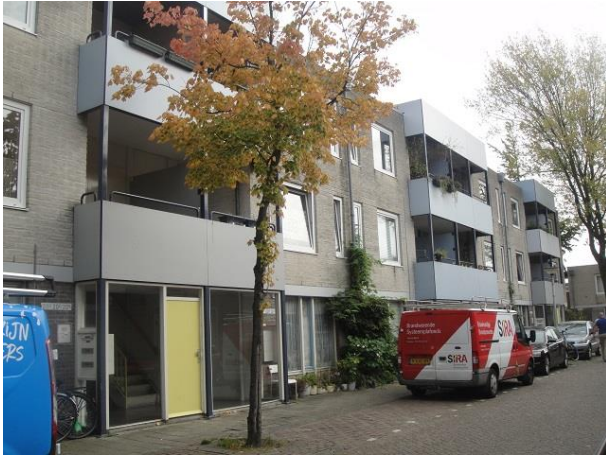
St Annastr 20 B

We gaan rechtsaf de Sint Annastraat in en beginnen hier rechts. Daar zien we waar vroeger de Sint Annakerk stond op nr. 20c tm 20t (18 adressen) een in 1984 in opdracht van Publieke Werken gebouwd woongebouw, drie lagen hoog en de architectuur is van Jo Hurkmans en KOVOS uit Eindhoven. Uitgebouwde stalen balkons zorgen voor de horizontale geleiding.