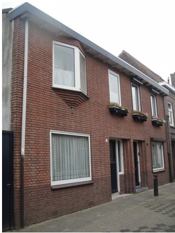
v Sonstr 37