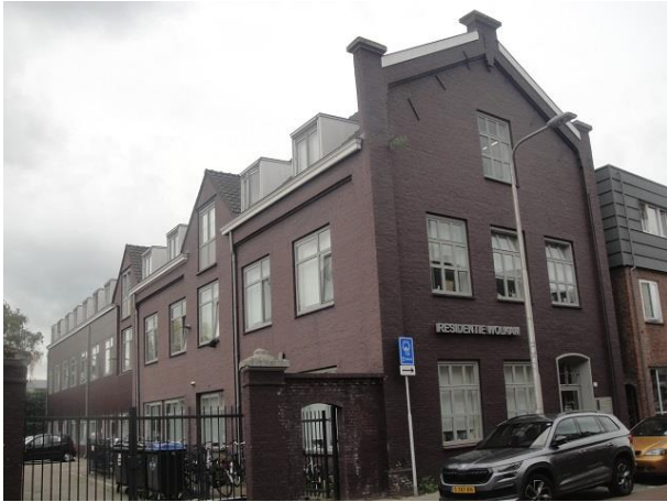
Lange Schijfstr 107-135

Nr. 107 is een oud pakhuis. In 1912 werd het uitgebreid. Het was toen eigendom van de heer D. Gersons, een koopman. F.C. de Beer was zijn architect. In de loop der tijd hebben er allerlei bedrijven in gezeten. Het pand is onlangs verbouwd tot 15 appartementen in opdracht van architect G.J.B.W. Scholten. Hierbij heeft het veel historische kwaliteit verloren. De bakstenen gevels zijn geschilderd en de oorspronkelijke ramen zijn vervangen door vlakke profielloze kunststof kozijnen. Als Residentie Wolkam herbergt het nu 15 adressen: nr. 107, 107-02, 109 tm 135.