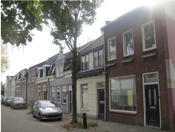
St Annastr 29-35

De brandslangen werden toen van canvasstof gemaakt. Die stof was op zich niet waterdicht. Pas als ze natgemaakt werd was dat het geval. De torens werden gebruikt om de natte slangen te drogen te hangen. Als ze gedroogd waren konden ze in opgerolde toestand met de brandweerauto vervoerd worden.