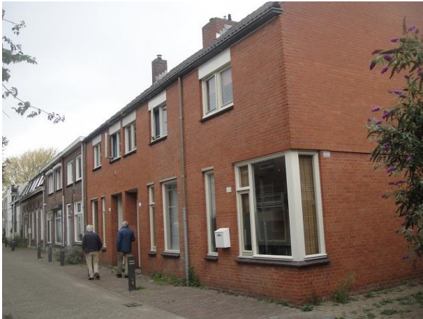
St Annastr 44a-36