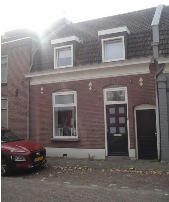
St Annastr 35