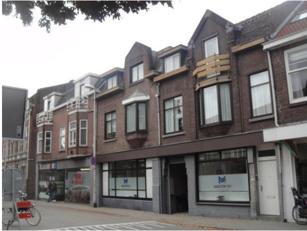
St Annaplein 7a-6

Nr. 7 en 7a zijn oorspronkelijk twee winkelhuizen geweest. Over het rechtse pand verstrekt het bouwarchief geen informatie, over het linkse dat het pand in 1925 door manufacturierster C.M. van Asten gebouwd is onder architectuur van Jos. Panis en dat in 1931 de twee winkelhuizen door C. van Asten, handelaar in meubelen zijn samengevoegd. Een beetje somber gebouw door de bruine kozijnen en boeiboorden. We mogen aannemen dat Panis ook het rechter winkelhuis ontworpen heeft. Nr. 6 is in 1929 gebouwd. Het waren toen twee winkelhuizen met in de tuin een bontwerkerij en de opdrachtgever was de Firma Dora van der Ven. De etalage is niet meer origineel maar de panden vormen toch een imposant geheel. De naam van de architect is helaas niet meer te ontcijferen.