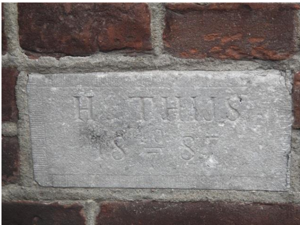
St Annastr 38 Ds