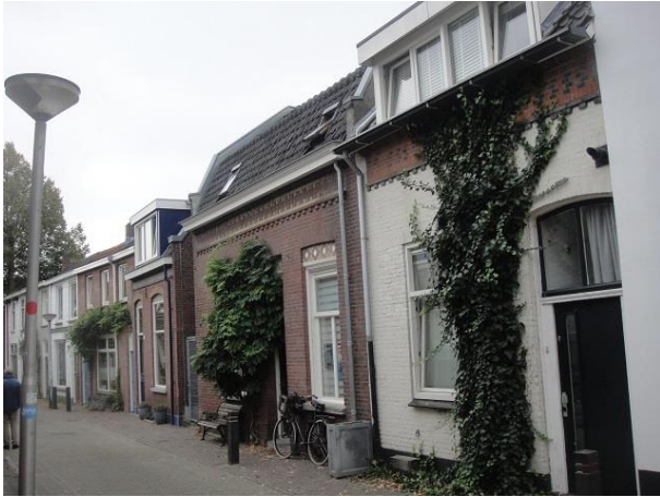
St Annastr 43a-45