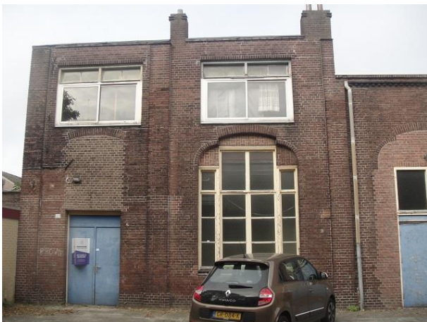
St Annastr 16 B

Op nr. 20 zien we een voormalig basisschool die als we het goed hebben op zijn laatste benen loopt of staat. De school kent een zeer lange geschiedenis. Ze zal ook dateren van eind negentiende eeuw, net als de kerk. In 1906 wordt de bewaarschool verbouwd tot jongensschool. De gevel waar we nu op kijken dateert van 1964. Ze is ontworpen door architect Van Boldrik uit Maarhees. De school heette toen de Joachimschool. De kinderen van Ad hebben er nog op gezeten.