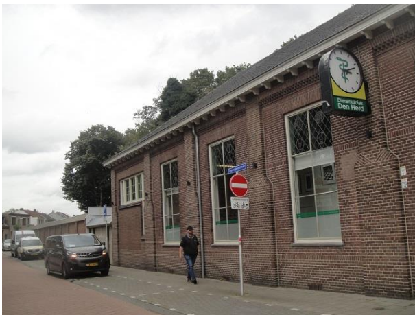
Capucijnenstr 78 B

We gaan rechtsaf de Paterstraat in en bekijken hier de rechterkant van die voornamelijk in beslag genomen wordt door de kapel van het kapucijnenklooster. Maar op nr. 50 treffen we dan toch nog één adres aan. Hier zetelt de Dogmatische Unie in een pand waar ook het voormalige KMTgebouw was gehuisvest, Capucijnenstraat 78. Ook over deze panden schreven wij in moNUment nr. 200 dat wij ook hier letterlijk aanhalen.