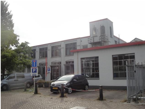
St Annahof 1-22

De Gemeente heeft toen ook tussen de woningen 27 en 29 de doorbraak naar de brandweerkazerne gemaakt die we nu zien. Dat heeft geresulteerd in een nieuwe gekleurde zijgevel voor het huis aan de overkant op nr. 29, gebouwd in 1986.