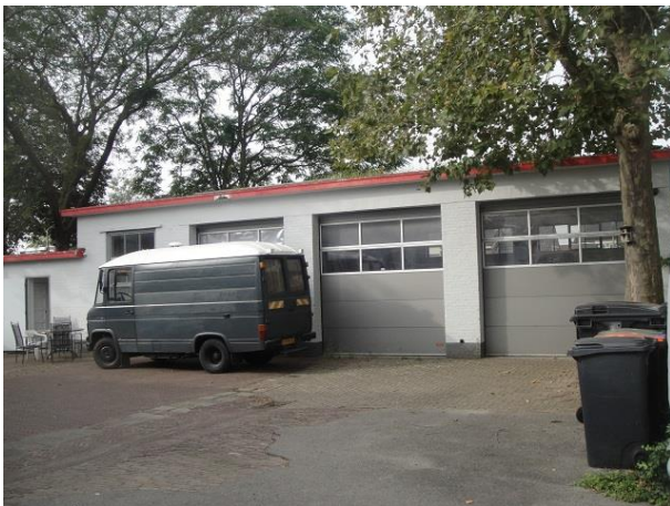
St Annahof 23-26

We maken gebruik van deze doorbraak en zien aan de Sint Annahof de voormalige brandweerkazerne ( Sint Annahof nr. 23, 26, 1 tm 7, 9, 10 en 13 tm 22). Het gebouw lijkt nog steeds door de Stichting Ateliers te worden beheerd terwijl er al vanaf 2018 een goedgekeurd bouwplan ligt voor 'het herontwikkelen van een brandweerkazerne tot 12 woningen en bedrijfsunits'.