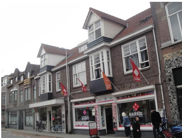
St Annaplein 12-7