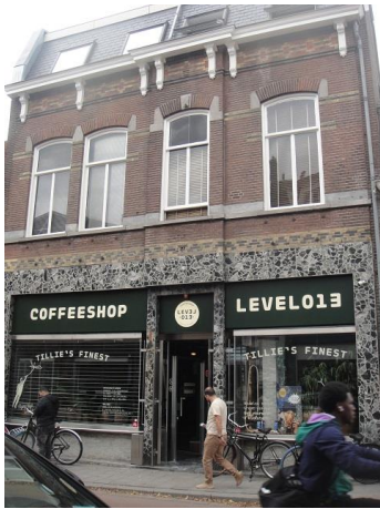
St Annaplein 13