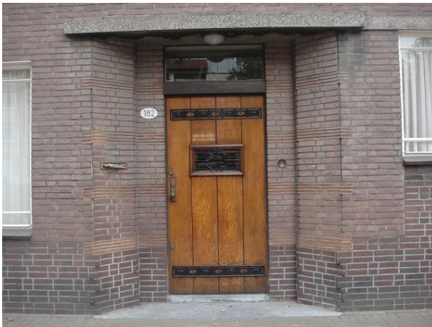
Schouwburgring 182 D