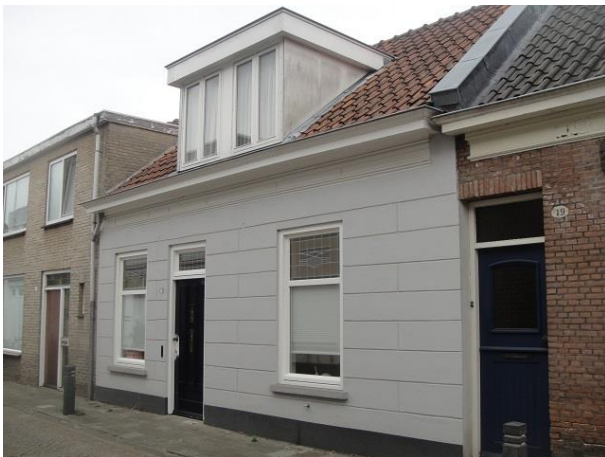
v Sonstr 21

Nr. 17 en 19 zullen ook tegelijkertijd gebouwd zijn. En ook nr. 21 en 23. Alle vier zadeldakwoningen van vòòr 1900. Bij 17 kom ik in 1929 de naam van ploegbaas A. de Beer tegen en bij nr. 19 in 1931 de naam van winkelier J. van de Wouw. Nr. 17 heeft in 1998 de huidige gevel gekregen met de grote dakkapel, zijn ingekorte deur en verbreed raam. Bij nr. 19 is datzelfde gebeurd in 1967.