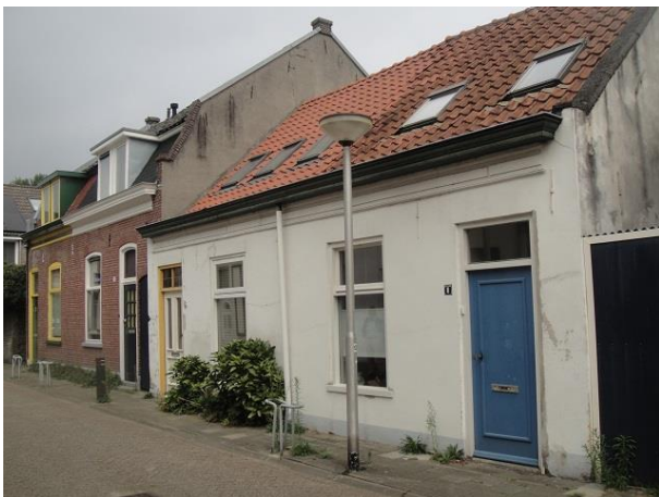
v Sonstr 8-2

De nummers 16 tm 10 vormen nog een mooi ensemble met hun doorlopende goot en kozijnen en deuren die een eenheid vormen. Die dakkapellen van nr. 12 vallen wél op. Ze zijn in 1996 aangebracht. Vier huizen, meer dan honderdtwintig jaar oud.