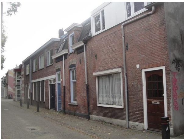
St Annastr 13-27a

We gaan rechtsaf weer de Sint Annastraat in, nu voor de westzijde. Op nr. 5 en 7 zien we nog twee mooie panden. We zien een fraai vormgegeven topgevel boven de voordeuren met diepe neggen. Nr. 7 heeft zijn raamindeling veranderd. Op nr. 9, 11 en 11a zien we weer drie woningen van de combinatie Publieke Werken, Hurkmans en KOVOS, gebouwd in 1984. Deze keer de paarse versie.