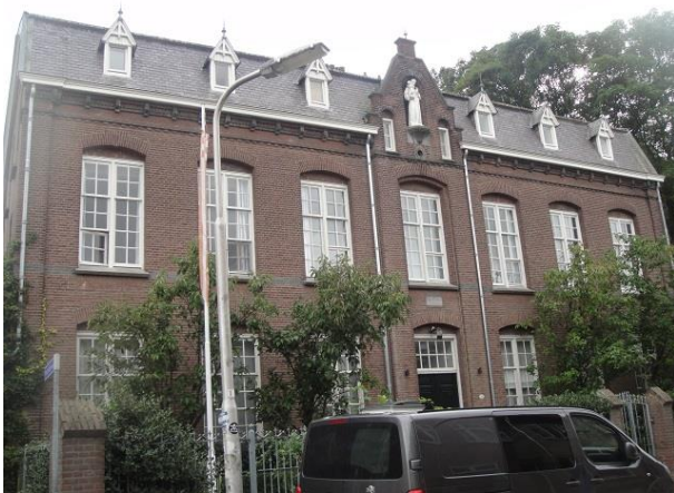
Capucijnenstr 76 A

We vervolgen onze weg langs de tuinmuur die nu een echte tuinmuur is totdat we op nr. 76 weer een rijksmonument tegenkomen: rechts het voormalig fraterhuis en links het voormalige jongensweeshuis Anthonius van Padua dat dateert van 1894 en is ontworpen door H. van den Abeelen. Achter het Fraterhuis de in 1933 gebouwde kapel van architect Constant Panis. Vanwege zijn heldere akoestiek is er nu een opnamestudio (Maarten Hartveldt, een naam die we net al tegenkwamen) in gehuisvest. Een mooi torentje bekroont een dak belegd met geglazuurde romaanse pannen. Links van de kapel en achter het weeshuis zijn in 1991 door de Vereniging Volkshuisvesting Tilburg 36 seniorenappartementen gebouwd die uitkijken op de nu openbare fraterstuin. (architect Pierre van der Geldt). (Frater Mattheushof 2tm 12, 14 tm 22, 24 tm37). In het weeshuis zit nu een steunpunt voor bejaarden (Frater Mattheushof nr. 1, 13 en 23) en in het klooster en de kapel zijn enkele bedrijfjes gehuisvest. (Capucijnenstraat 76, 76-01 tm 76-09 en Mattheushof 40 en 41).