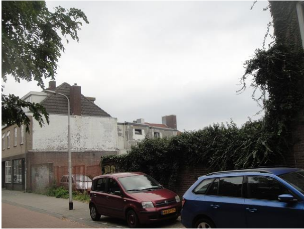
Capucijnenstr 20-18 open

Dan volgt een stukje al jaren braakliggend terrein dat we het predicaat verbeterpunt meegeven. Qua huisnummers is er ruimte voor twee woningen.