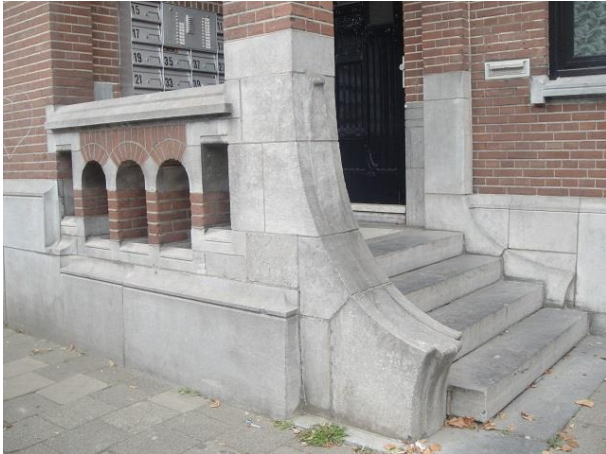
Zomerstr 17-47 Dv