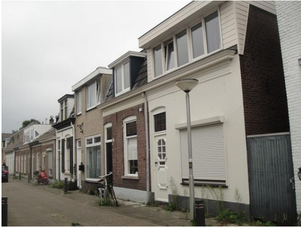
v Sonstr 24-18