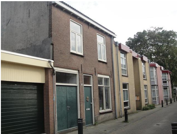
St Annastr 2-4a

Op nr. 14a, 12a, 10a en 8a zien we vier eengezinswoningen die als één bouwplan in 1986 zijn gebouwd door de combinatie Publieke Werken, Hurkmans en Kovos. Deze woningen hebben roze gevels. Op nr. 6a en 4a volgen dan nog twee woningen die ook één bouwplan vormden, ook van de combinatie PW, Hurkmans en Kovos zijn maar gele gevels hebben. Ook van 1986.