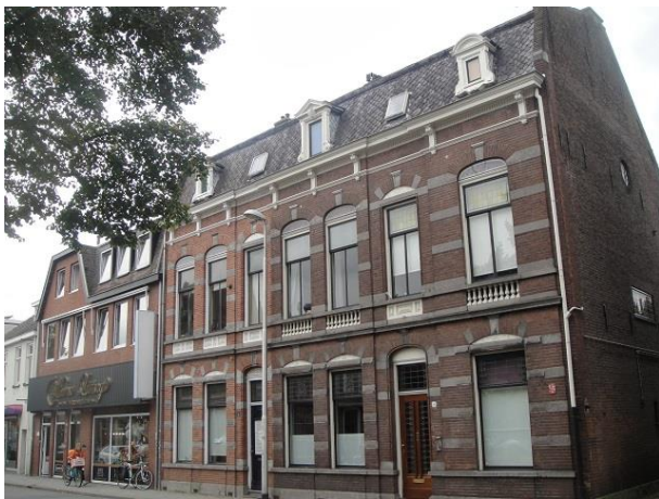
St Annaplein 4-Korvelseweg 15